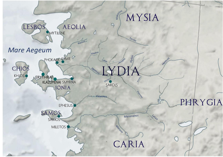
Figür 5: Batı Anadolu nehirleri