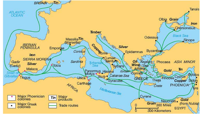
Figür 2: Büyük Kolonizasyon rotaları

çok sayıda koloninin kurulduğu 18 ve bu nedenle söz konusu dönemin Eskiçağ literatürüne “Büyük Kolonizasyon Dönemi” olarak geçtiği bilinmektedir 19 . Yaklaşık 150 koloninin kurulduğu 20 bu süreçte yer alan Phokaia, Miletos ile birlikte en çok koloni kuran kent olmuştur 21 . Phokaialılar MÖ 7. yüzyılda Adriatik, Etruria, İberia ve Tartessos’a 22 kadar gitmişler, Batı Akdeniz’de, Güney Fransa’da Massalia’yı (Marsilya), Güney İtalia’da Lucania’nın batısındaki Elea (Velia), Korsika’da Alalia ve İspanya’da Emporion (Ampuria) koloni kentlerini kurmuşlardır (fig. 2). Massalia bölgesinde, Güney Fransa’daki Nice’te (Nicaea-Nizza) ve Antibes’te (Antipolis) kurdukları koloni kentleri ise diğerlerine göre daha küçük çaplıdır. Phokaia, Arkaik Dönem’de özellikle Akdeniz’de hem korkulan hem de hayran bıraktıran büyük bir deniz gücüne sahip olmuştur ve buna günümüzde “Thalassokrazi” adı verilmiştir. Naukratis’te üretilen mavi fayanslar, Phokaialı denizciler aracılığıyla İspanya’daki Emporion sitesine taşınmıştır. Bundan başka Phokaia, Akdeniz Havzası’nda demir, gümüş, kalay ve bronz taşımacılığını gerçekleştirmiş, bu mallara karşılık Mısır olmak üzere diğer Akdeniz kent-devletlerinden buğday, bazı gıda maddeleri, lüks mallar ve eşyalar almıştır 23 .