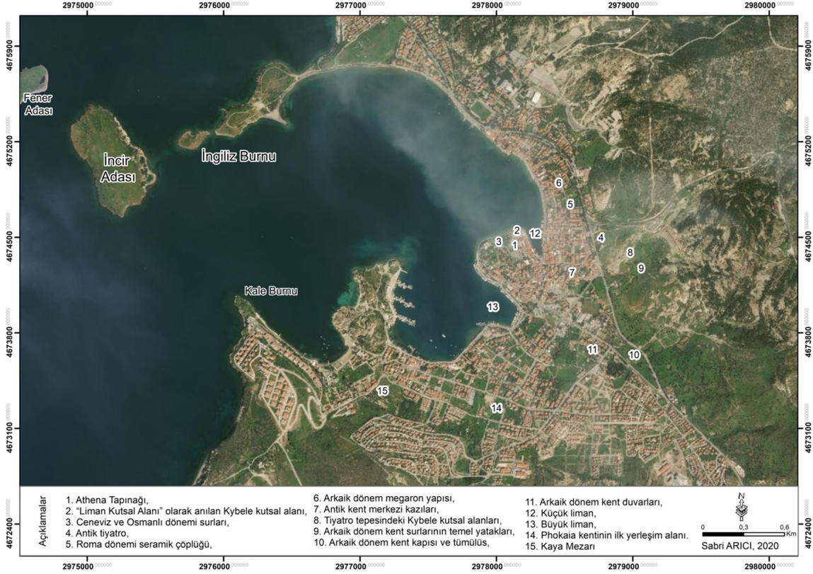
Figür 1: Phokaia'nın limanları ve genel görünümü