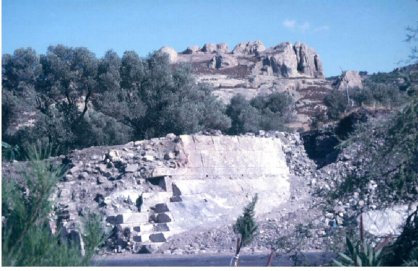
Figür 6: Phokaia kent suru

göre 77 , İspanya'daki Tartessos kralı Argonthonios'un, Phokaialıların Medlere karşı kendilerini koruması için verdiği parayla kent suru inşa edilmiştir. MÖ 590-580 yılları arasında yapıldığı düşünülen bu surların (yaklaşık 5 km uzunluğunda) bir kısmı günümüzde arkeolojik kazılar sonucunda ortaya çıkarılmıştır 78 (fig. 6). Phokaia surları, özellikle eğimli destek duvarıyla (payanda) ve düzgün kesme taşlarıyla güçlü Sardis surlarını anımsatmaktadır 79 . Bu durum, Ephesos ve Smyrna'da Lydialı taş ustalarıyla birlikte çalışıldığı görüşünü de desteklemektedir 80 . A. Baran 81 , Phokaia surlarının yapımı sırasında Lydia ile dostane bir ilişkinin olabileceğini düşündüren bir görüş ortaya koymaktadır: