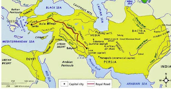
Figür 3: Phokaia-Sardis hattı ve Kral Yolu

birbirine bağlanmış ve Ege kıyılarına mal getirmiştir 41 . Paktolos Çayı (Sart), Sardis'in içinden geçerek birkaç km yakınındaki Hermos Nehri'ne dökülür. Herodotos 42 , Hermos Nehri'nin bir zamanlar Phokaia'nın yakınında denize döküldüğünü aktarmaktadır. Phokaia'nın Hermos'a (güney-doğusuna) bakan tarafında sırt ve tepeler mevcut olduğundan, C. H. Roosevelt'in aktardıkları kuvvetle muhtemeldir ki, Hermos Phokaia'nın güneydoğusundaki bugün Deniz Kuvvetleri Komutanlığı'na bağlı kullanılan Hacılar Limanı yakınında denize dökülmüştür.