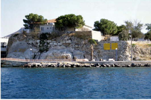
Figür 7: Phokaia Kybele kaya kutsal alanı

Antik çağda toplumlar arası etkileşimde kültürün çok etkisi vardır. Phokaia'da yer alan kültürler arasında Ana Tanrıça Kybele, önemli bir yer tutmaktadır 89 (fig. 7). Phokaia'daki bu kültür Lydia'dakinden etkilenmiştir 90 . Phrygia'nın Lydialıların hakimiyetine girmesinden sonra, bu kültürün batıya yayılım yolu da açılmıştır. Lydialılar Phrygialıların Kybele kültürünü benimsemişler 91 ve Batı Anadolu'daki kent devletleri ile olan ticari ve siyasi ilişkileri sırasında Ana Tanrıça'nın kültürünün buralara da yayılımını sağlamışlardır. Böylece, tanrıçanın kültürü önce Ege kıyılarına, ardından adalara ve oradan da Yunanistan üzerinden Güney Fransa'ya kadar ulaşmıştır 92 .