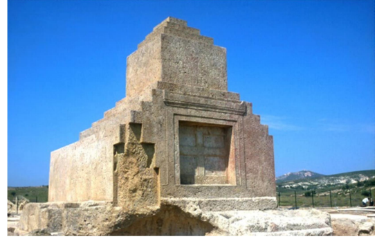
Figür 4: Phokaia'daki Pers Mezar Anıtı