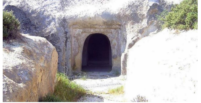
Figür 8: Phokaia Şeytan Hamamı kaya mezarı

Phokaia'nın kente bakan güney yamacında, halk arasında Şeytan Hamamı olarak adlandırılan kayalara oyulmuş bir mezar bulunmaktadır (fig. 8). MÖ 4. yüzyılın sonunda yapıldığı tahmin edilen bu mezar, uzun bir dromosa sahiptir ve mezarın Lydia etkisinde yapıldığı ileri sürülmektedir 93 . Kentte, henüz arkeolojik kazısı yapılmamış bir tümülüsün varlığı da bilinmektedir 94 . Bu örnekler, Phokaia'daki Lydia etkisinin günümüze ulaşan kanıtları olarak düşünülmektedir 95 .