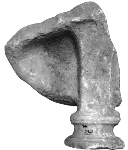
Figür 3c: Büst 2, arka yüz