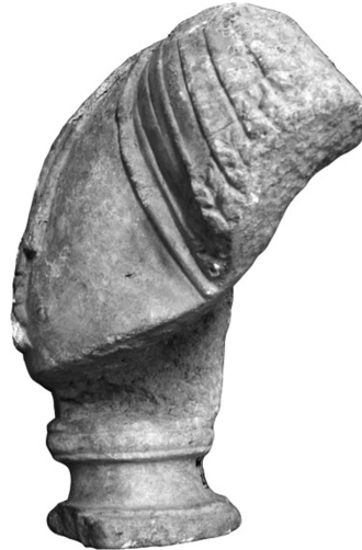
Figür 3b: Büst 2, sol profil