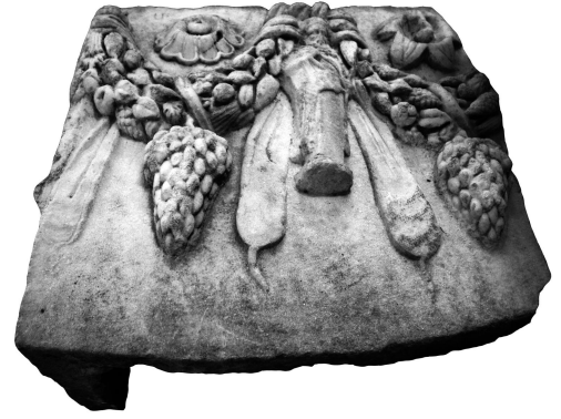
Figür 1: Aydın Arkeoloji Müzesi'nden Menderes Antiokheiası buluntusu lahit parçası

Bu çalışmada ele alınan üç plastik eser dışında günümüzde Aydın Arkeoloji Müzesi'nde korunan, 2656 envanter numaralı, girland taşıyıcısı olarak Herakles Hermesi betimlenen bir lahit parçası yer almaktadır (fig. 1). Söz konusu eserin müze envanter kayıtlarında Aydın ili, Kuyucak ilçesi, Başaran mahallesinden 16.05.1981 tarihinde müzeye getirildiği belirtilmektedir. Menderes Antiokheiası buluntusu olan bu lahit parçası, 1996 yılında V. M. Strocka 8 ve 2007 yılında F. Işık 9 tarafından Aphrodisias girlandlı lahitler grubunda incelenmiştir. Aynı eser, 2012 yılında N. Yıldırım 10 tarafından Herakles Hermeleri özneline değerlendirilmiştir. Lahit parçası dışında kentin plastik eserleriyle ilgili herhangi bir araştırma bulunmamaktadır.