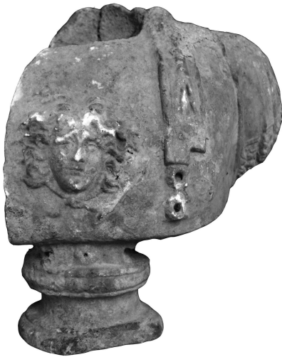
Figür 3a: Büst 2, ön yüz

Menderes Antiokheiası'ndan 2948 envanter numaralı ikinci buluntu 28 Aydın ili, Kuyucak ilçesi, Başaran mahallesinde bulunmuş, 07.05.1987 yılında satın alma yoluyla Aydın Arkeoloji Müzesi'ne kazandırılmıştır. Kalın grenli beyaz mermerden dairesel kaide üzerinde, omuzlardan göğüs altına kadar işlenmiş deri zırtlı erkek büstü, gövde ve kaideyle birlikte tek bloktan yontulmuştur (fig. 3a-c). Gövdeye sonradan eklenen portre eksiktir. Boyun çukurunda kırık ve çatlak izleri yer alırken, sağ omuz ve kaideden bir parça kırık ve eksiktir. Yüzey geneline yayılan patina görülebilmektedir. Bir tunik üzerine, merkezinde Medusa başı bulunan lorica giyimli büstün sol omzu üzerinden göğüs üzerine bir epomides sarmaktadır. Büst, dairesel formlu, iki torus arasında derin bir trokhilos bulunan Ionik kaide ile taşınmaktadır. Kaide ile göğüs arasında yazısız tabula yer almaktadır. Menderes Antiokheiası buluntusu büst parçası, lorica giyimli olmasının yanı sıra, göğüs üzerinde Medusa başı betimlenmesi nedeniyle bir imparator büstüne ait olmalıdır.