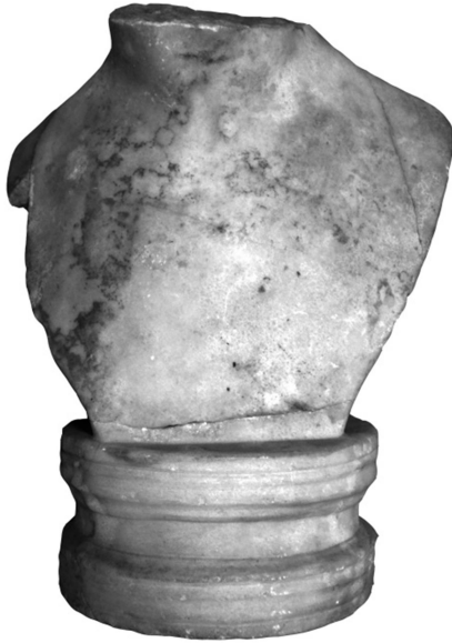
Figür 2a: Büst 1, ön yüz