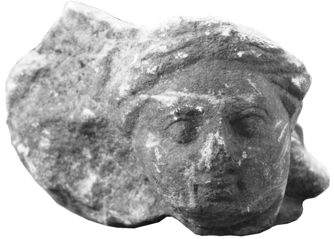
Figür 4: Kabartma parçası

Menderes Antiokheiası'ndan 2632 envanter numaralı üçüncü ve son örnek 52 , bir kabartma parçasıdır. Eser, Aydın ili, Kuyucak ilçesi, Başaran mahallesinde bulunmuş ve 20.01.1981 tarihinde satın alma yoluyla Aydın Arkeoloji Müzesi'ne kazandırılmıştır. Kalın grenli beyaz mermerden yapılmış eser yüksek bir kabartmaya ait olmalıdır (fig. 4). Sadece dış yüzeyinden bir parça korunmuş, diğer kısımlar kırık ve eksiktir. Korunan kısımda boynun solunda el parçası bulunan yüksek kabartma bir erkek başı betimlenmiştir. Gövde, boyundan itibaren kırık ve eksiktir. Yüzey geneline yayılan patina görülmektedir. Dalgalı saçlar alın üzerinde ortadan ikiye ayrıldıktan sonra yanlardan kulakların üst kısmını kapatarak arkaya yönelmektedir. Yüz, yuvarlak hatlı ve dolgun, alın geniş ve yüksektir, göz kapakları etli verilirken iris ve pupilis işlenmemiştir. Yanaklar dolgun, burun geniş, ağız kapalı, dudaklar dolgun ve çene yuvarlatılmıştır.