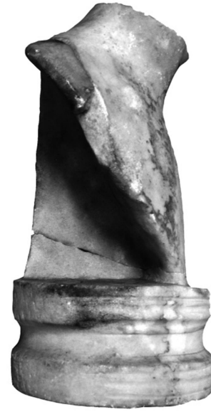
Figür 2b: Büst 1, sağ profil