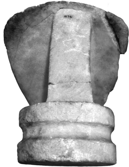
Figür 2d: Büst 1, arka yüz