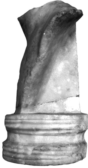
Figür 2c: Büst 1, sol profil