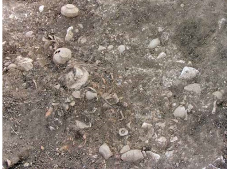
Figür 6: Miletos Zeytintepe'de minyatür kapların bulunduğu sondajın görünümü

Miletos'ta ise kentin iki ayrı noktasında minyatür kaplar gün yüzüne çıkarılmıştır. Bu gruplardan ilkinin Humeitepe'de Demeter Kutsal Alanı temenos unda bulunan iki yüzü aşkın minyatür hydria oluşturur 42 . Burada ayrıca figürinler ve az miktarda kernos parçası ele geçmiştir. Bu buluntular kutsal alan için hâlihazırda ortaya konan kimliklendirmeyi destekler argümanlar olarak görülmüştür. M. Pfrommer, çeşitlilik gösteren hydrialardan bazılarının tipolojik olarak Priene ve Pergamon'da ele geçen hydrialarla benzerliklere sahip olduğunu ifade eder 43 . 2007 yılında Zeytintepe'de bulunan Aphrodite Kutsal Alanı'ndaki dolgu tabakalarında yapılan sondaj çalışmaları esnasında bir sondajda, MÖ Erken 7. yüzyıla tarihlenen toplu buluntu ortaya çıkarılmıştır 44 . Buluntuların ağırlığını Miletos üretimi minyatür kaplar oluşturur (fig. 6). Sondajda bunların yanı sıra Korinth aryballosları ve Daidalos üslubunda figürinler de kaydedilmiştir.