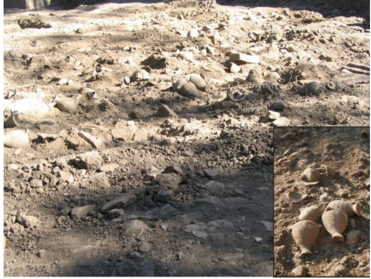
Figür 3: Antandros'ta gün yüzüne çıkarılan minyatür hydriai

konu alan C. E. Barrett, neredeyse tümüyle aynı ikonografiyi gösteren iki timsah heykelinin malzeme ve fiziksel özelliklerine bağlı olarak izleyicide farklı hisler uyandırdığını ortaya koyar 25 . Görece büyük boyutlu heykel belirli bir mesafeden izlenirken; küçük, zarif ve ince işçilik gösteren figürin izleyiciyi yakınına davet eder. Barrett, Roma yazını ve sanatında genellikle tehlikeli varlıklar olarak karşımıza çıkan timsahların izleyicilerin yukarıdan bakabildiği küçük boyutlu temsillerinin böylesi bir tehdit uyandırmadığını belirtir 26 .