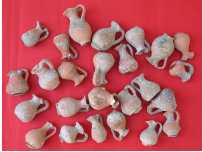
Figür 4: Klaros'ta bulunan khous lardan örnekler

Klaros Kutsal Alanı'ndaki Lucullus Anıtı'nın batısında kalan alanda, 1996-1997 yıllarında gün yüzüne çıkarılan kontekst, çok sayıda minyatür khous , çömelen çocuk ve kourotrophos figürinleri, çeşitli hayvan kemikleri ile sikkeleri barındırır 35 . Minyatür kapların khous olduğunun tespitinin ardından kontekst, Anthesteria Festivali çerçevesinde değerlendirilmiştir. Attika'dan bilinen bu festival kapsamında üç yaşını dolduran çocuklara şarabı tatmaları için armağan edilen khouslar (khoues) (fig. 4), Klaros'ta birlikte ele geçtikleri çömelen çocuk figürinleri ve kourotrophoi ile bu bağlamda ele alınmıştır 36 .