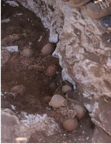
Figür 5: Kaunos Demeter kutsal alanından minyatür hydriai

olarak yorumlanmıştır 39 . Obruk tabanındaki toprakta ise hayvan kemikleri, minyatür kaplar, az kullanılmış ya da hiç kullanılmamış adak kaplarının yanı sıra çok sayıda pişmiş toprak heykelcik parçası görülmüştür 40 . Buradaki kontekst, ihtiyatlı bir şekilde Hellenistik ve Roma dönemlerinde, içinde kutsal şölenlerin düzenlendiği ve adakların adandığı bir mağara kült merkezi olarak değerlendirilmiştir 41 .