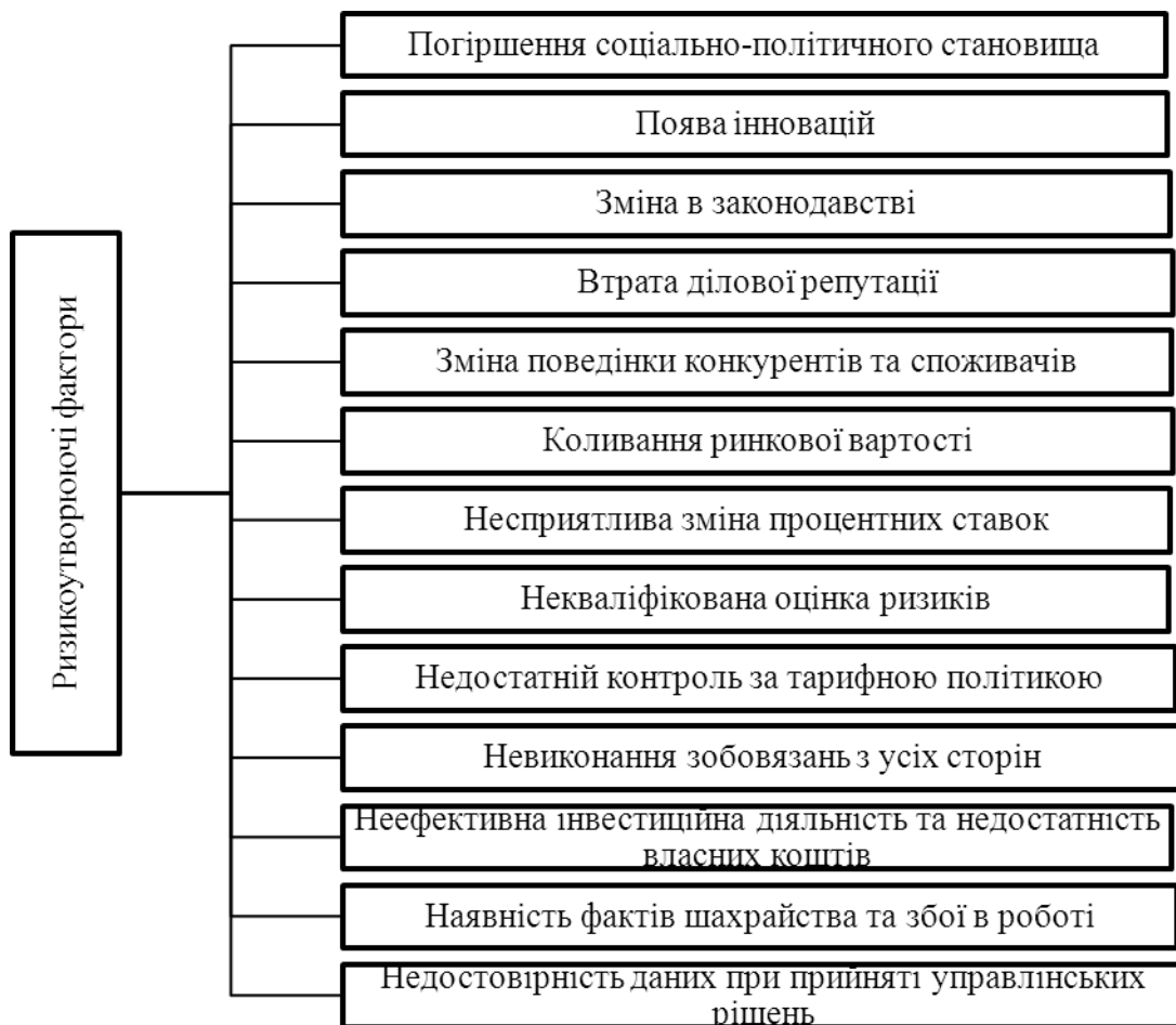
Рис.2. Ризикоутворюючі фактори, які впливають на фінансову стійкість страхових компаній

З метою побудови дієвої системи управління ризиками страхової компанії, зокрема й ризиком її фінансової стійкості, надзвичайно важливим є визначення якомога більшого переліку ризикоутворюючих факторів, які спроможні впливати на формування конкретних типів ризиків (рис. 2).