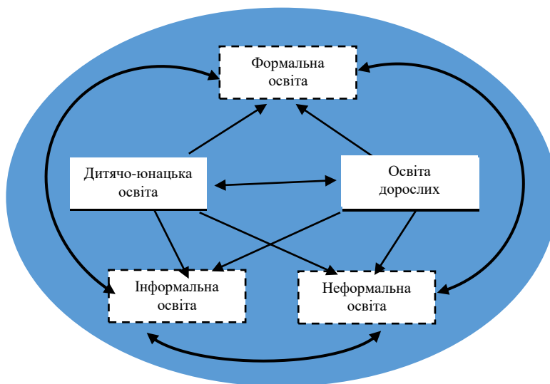
Рис. 3. Взаємодія між суб'єкторієнтованими та засобово орієнтованими складниками системи неперервної освіти

Відповідно до наших міркувань, формальна, інформальна та неформальна освіта є засобово орієнтованими складниками системи неперервної освіти. Як показано на рисунку 3, ці складники розглядаються нами не ізольовано, а у взаємодії з суб'єкт орієнтованими складниками системи неперервної освіти, до яких ми відносимо дитячо-юнацьку освіту та освіту дорослих.