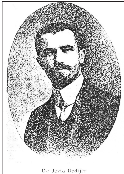
Dr Jevto Dedijer

Rođen je 15. augusta 1880. godine u selu Čepelica kod Bileće. Još kao gimnazijalac u Mostaru počeo se interesovati za pitanja položaja i načina funkcionisanja sela. Doktorirao je u Beču 1907. godine, nakon čega se zaposlio u Zemaljskom muzeju u Sarajevu i tu je radio sve do aneksije 1908. godine. Tokom 1910. godine odlazi u Beograd gdje se zaposlio kao docent geografije na beogradskom Univerzitetu. Početkom Prvog svjetskog rata emigrirao je u Francusku, pa potom u Švicarsku. Nakon završetka rata vratio se u Bosnu i Hercegovinu, gdje je i umro 24. decembra 1918. godine u Sarajevu.