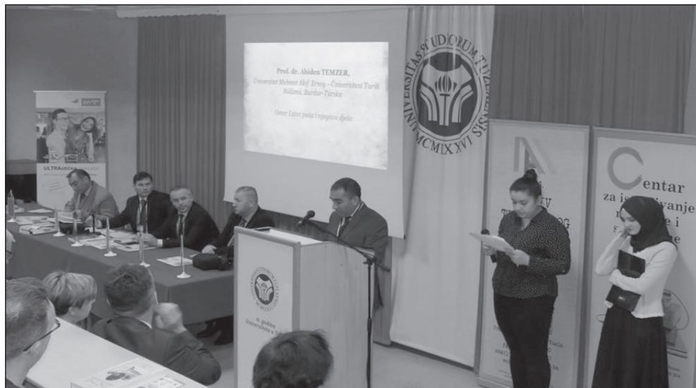
Prilog 3. Detalj sa naučne konferencije "Znamenite ličnosti u historiji Bosne i Hercegovine"