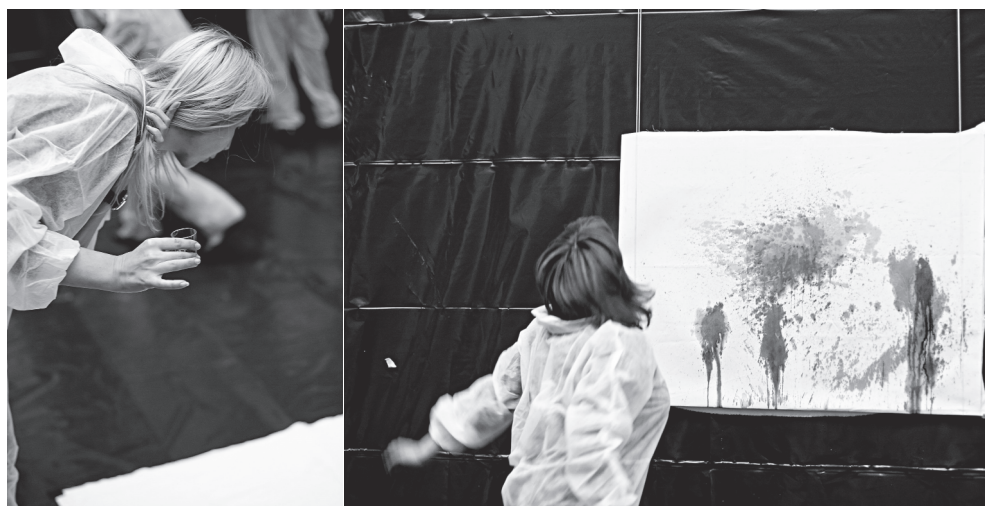
Slika br. 5. i 6. Omaga Open Space-u, "Pljuvanje na društvenu nepravdu", 2015.

Semantička prezentacija umjetničkog aktivizma je uvijek određena kontekstom u kojem se nalazi. Projekcija "Prekipilo" (2015) je digitalni mapping na zgradu Akademije dramskih umjetnosti prije deložacije svih kulturnih radnika vezanih za tu instituciju. Bosanski lončić je simbol bosansko-hercegovačkog identiteta i rituala u svakodnevnom životu. Provokativni cinizam je vizualiziran projekcijom video rada "Prekipilo" kao glavno sredstvo disproporcije umjetničke vrijednosti i kulturnih institucija, uopšte. U susretu sa novim procesom privatizacije i ulaskom na slobodno tržište kapitala ljubitelji, studenti i zaposleni Akademije dramskih umjetnosti Tuzla, pridonijeli su kritici društva i novog političkog poretka svojim specifičnim metodama socijalnog aktivizma. Dekonstrukcijom značenja u umjetnosti i komercijalnom provokacijom na zgradama od društvenog značaja, umjetnici nastavljaju proces odašiljanja poruke koja će doći do običnih ljudi i njihovih prostora. Astral Bust je je početak javnog reprezentovanja koceptualnih radova za pružanje otpora društveno-političkoj stvarnosti.