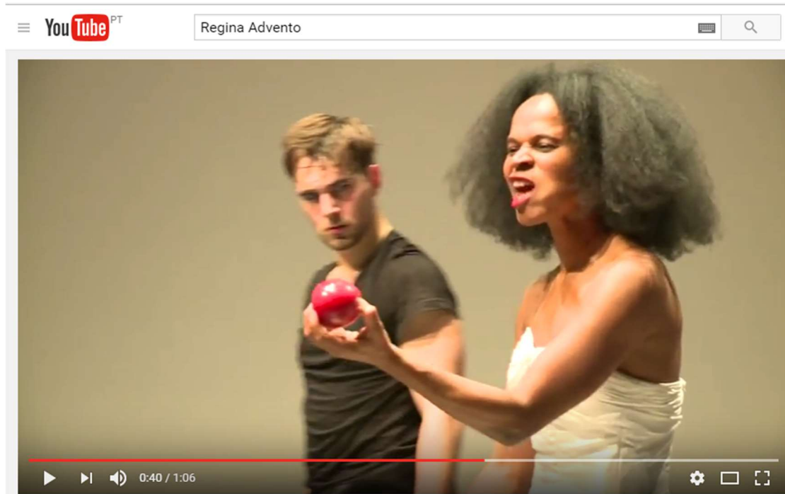
Fig.3: Printscreen do trailer 2 de Minuten Beat . Frame do trailer de Minuten Beat – pormenor da maçã trincada, de que Regina Advento tem um pedaço na boa.

Em cena, encontramos uma série de objetos simbólicos, como um relógio na parede que preconiza o tempo, os 60 segundos/batimentos cardíacos por minuto e o comer de uma maçã, o “pecado original”, utilizados para reforçar a linguagem e, conseqüentemente, a mensagem, ainda que tenhamos a consciência de que, como defendido por Gil (2001) « os gestos e movimentos desdobrados pelos afectos de vitalidade não precisam de ser explicados para serem compreendidos: contêm em si o seu sentido e o seu dispositivo de descodificação (que não é senão o seu próprio desdobrar-se). » (Gil, 2001: 105).