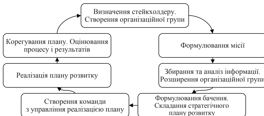
Рис. 2. Технологія розвитку соціального капіталу територіальної громади

Складові технології публічного управління включають наступні етапи своєї реалізації (рис. 1–2).