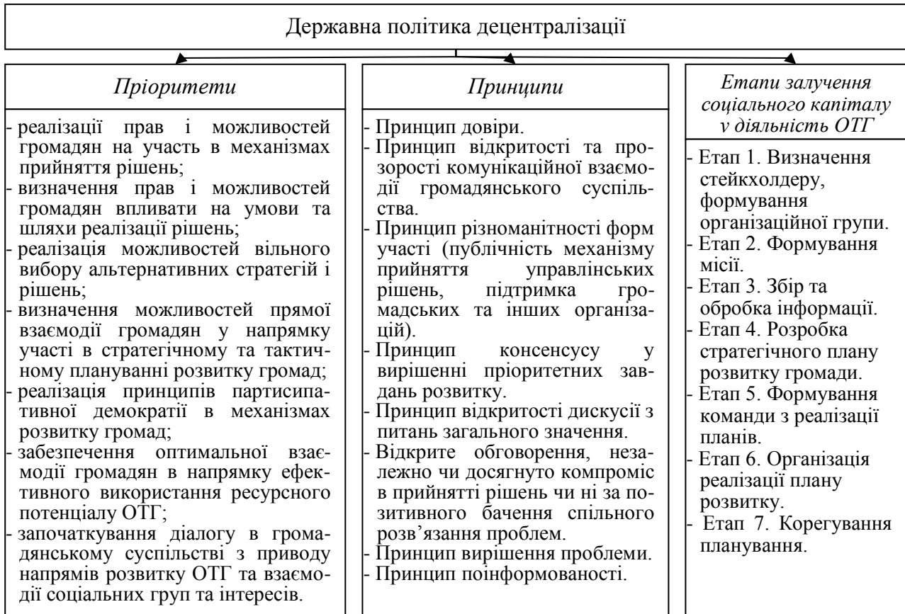
Рис. 1. Складові успішності державної політики децентралізації

Сталий розвиток окреслює нові перспективи становлення соціального капіталу, цільову спрямованість громади, її проєктів та програм, ефективність використання ресурсів, рівень життя. Він є передумовою демократизації суспільства та сприяє утворенню зв'язків між суб'єктами громад, громадами та іншими стейкхолдерами щодо спільного вирішення проблем розвитку територій, співпраці з урядом, органами місцевого самоврядування, бізнесовими структурами тощо. Формальні та неформальні інститути громад мобілізують соціальний капітал на вирішення завдань розвитку, визначають напрями використання ресурсної бази, є основою самозабезпечення, виявляють еліту та лідерів, сприяють реалізації пріоритетів державної політики (рис. 1). Метою реалізації наведених принципів є практична спрямованість, активізація соціального капіталу ОТГ, рівні можливості та демократичні підходи щодо забезпечення представництва пересічних громадян, громадських організацій, наслідком яких стане стале, збалансоване зростання громадянського суспільства.