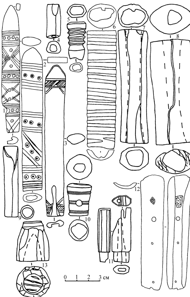
Рис. 1. Костяные рукояти ножей (1-3,5-8,11-12) и орудий (4,9-10,13) с Увецкого городища.

1,12 – ГИМ № 34162, оп. 952, №/№ 14, 16. 2,6 – ГЭ №/№ 30-42, 7273.137; 30-128, 7273,46 (40?), 7273.136. 3,5,10 – СОМК №/№ СМК 51998 (СУАК 1045/21); СМК 52043/А-2329 (АО 265/2; СУАК 216/22); СМК 52017/А-2303 (АО 1219). 4,7-9,13 – НМРТ № 5365-63, №/№ 43 (4), 133-134 (7-8), 142 (9). 11 – Археологический клуб-музей при Саратовской областной станции юных туристов № 91