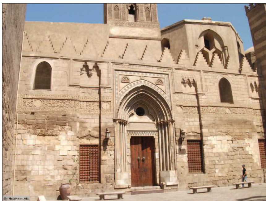
Рис. 1. Вход в четыреххайванное медресе, построенное по приказу султана ан-Насира (Каир, Египет)