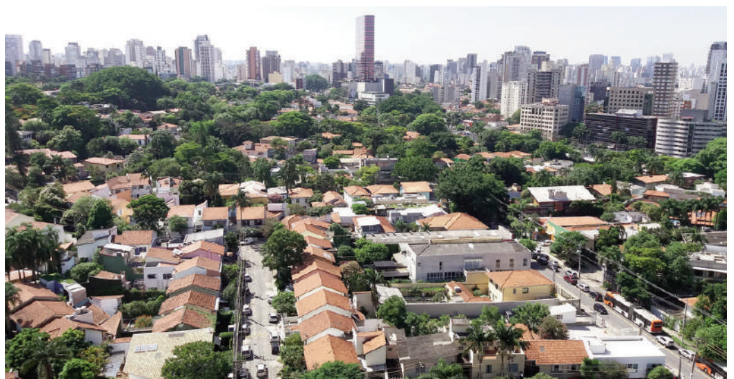
Fig. 1 | São Paulo branches urbanized under the concept of 'garden city'.

Il tema e i designer | Nel Paese non ci sono molti esempi noti di prodotti di designer o architetti realizzati con il legno derivante dall'attività di manutenzione ordinaria e straordinaria sulla vegetazione urbana. Uno dei pionieri è stato Zanine Caldas che ha usato il legno degli alberi abbattuti nei progetti di case e di mobili. Lo scultore Frans Krajcberg, a sua volta, si è distinto per le opere realizzate con tronchi e radici calcinate, come denuncia contro la devastazione delle foreste brasiliane. Pedro Petry crea mobili e oggetti d'arte da tronchi d'albero abbattuti (Figg. 13, 14); Carlos Motta è un designer di mobili realizzati con legno da abbattimento; infine, Hugo França (Figg. 15, 16) realizza panchine e attrezzature ricreative per parchi, esplorando le caratteristiche morfologiche degli alberi caduti.