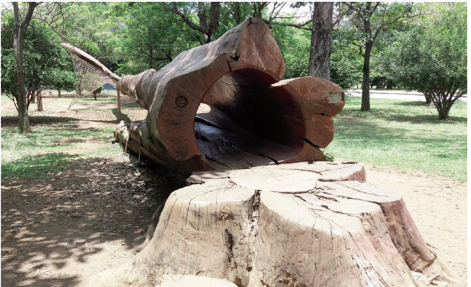
Fig. 15, 16 | Hugo França's wood recreational equipment in Ibirapuera Park.