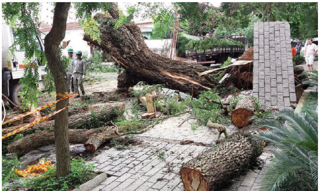
Fig. 10-12 | Annual pruning in University of São Paulo Campus; Branches removal in a city street; Removal of a fallen Tipuana tipu after a summer storm in 2019.