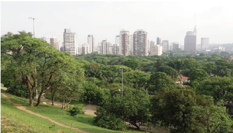
Fig. 2-5 | Partial views of Ibirapuera Park: São Paulo Obelisk in centre and city main north-south axis; Interior paths and trees; Park lake and Japanese bridge (credits: C. Malaguti, 2019).