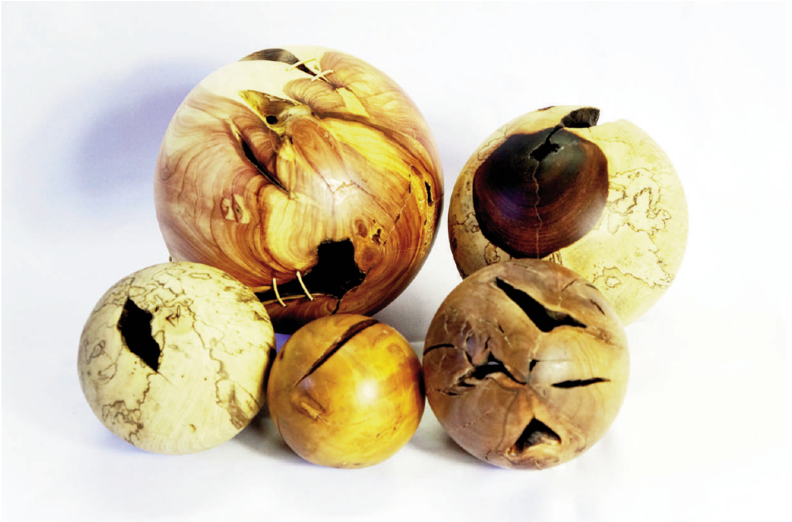
Fig. 13 | Pedro Petry's hollow spheres, Forest Jewels Sculpture.

there was no inventory of municipal afforestation 2 , until the conclusion of this paper, some of the most commonly occurring species are: among the exotic, Tipuana tipu , Jacaranda mimosifolia , Ficus Benjamina , Ligustrum Lucidum and Lagerstroemia indica ; among the natives of Brazil, Syagrus romanzoffiana (only regional native of Sao Paulo), Tibouchina granulosa , Caesalpinia peltophoroides , Caesalpinia ferrea and Tabebuia spp (Cardim, 2008). The complex management of urban afforestation is carried out by various public agencies, in addition to the local electric utility company – ENEL (Ente Nazionale per l'Energia Elettrica). Preventive work, which includes technical tree surveys, covers about 20,000 trees per year. If the specimen has fungi or presents a risk of falling, it is removed, reaching 44 trees/day, on average. On the other hand, the daily average of planting is 33 new specimens in the city streets (Amaral Ribeiro and Rodriguez Ramos, 2018), thus generating a deficit.