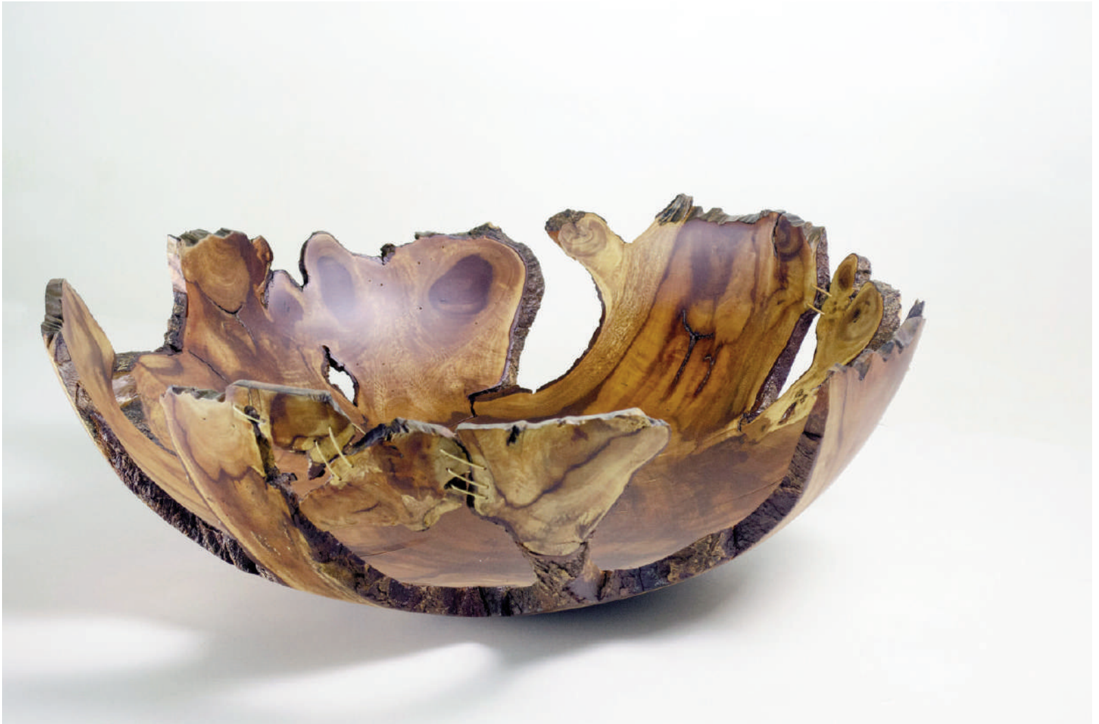
Fig. 14 | Pedro Petry's fruit bowl with jagged edges, diam. 67 x h 25 cm (credit: Danilo dos Santos).

heterogeneity and characteristics of the species, growth conditions and health) – it would be worth asking whether, given the numbers presented, the only and most appropriate destination for all local tree waste is composting or power generation, although other destinations may at first be more complex and costly.