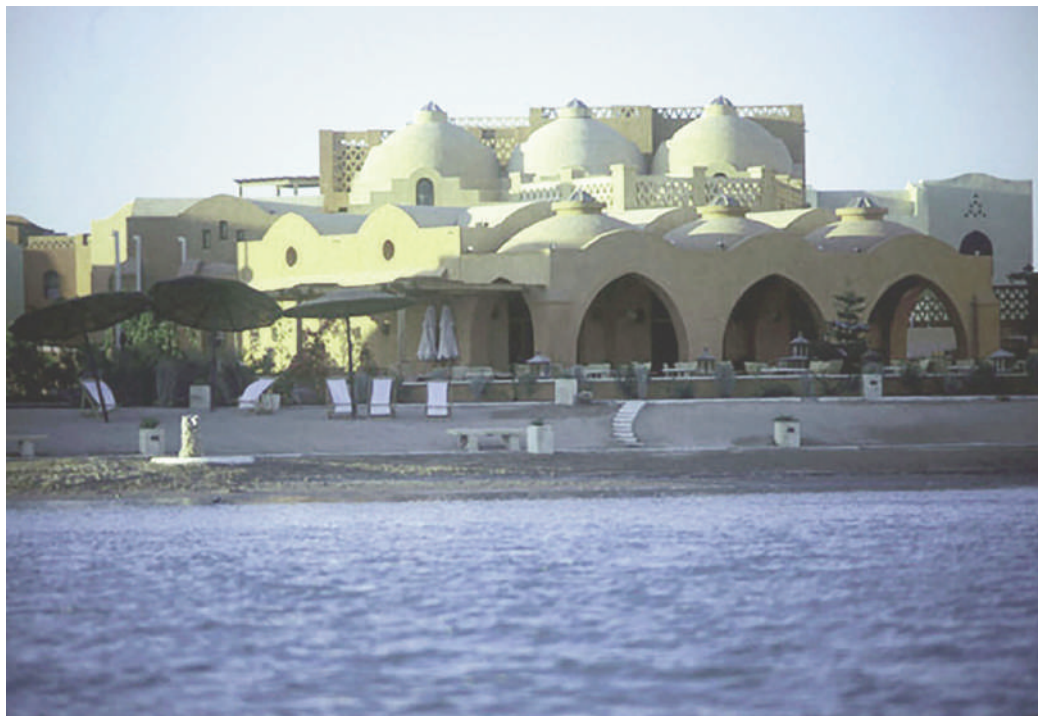
Fig. 4 | El-Gouna, Red Sea (credit: archnet.org, 2019).

In Egitto, il problema dell'efficienza energetica è iniziato a emergere quando il Governo ha deciso di realizzare nuovi insediamenti nelle aree desertiche a ridosso dei centri abitati, senza tenere conto delle condizioni climatiche e delle esigenze di comfort degli occupanti: l'intensità delle radiazioni solari e l'assenza di nuvole del cielo sono le principali cause dell'estremo livello di riscaldamento locale. Inoltre, l'architettura tradizionale, che ben si adattava alle condizioni climatiche del luogo, risulta poco compatibile con l'attuale offerta tecnologica, e quindi poco attrattiva per la società contemporanea. A causa delle limitate disponibilità finanziarie del ceto medio-basso, gli apparecchi per la climatizzazione degli ambienti sono