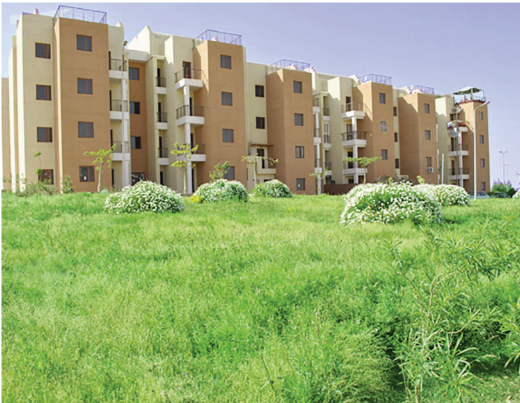
Fig. 9 | Haram City in 6th of October Suburb.