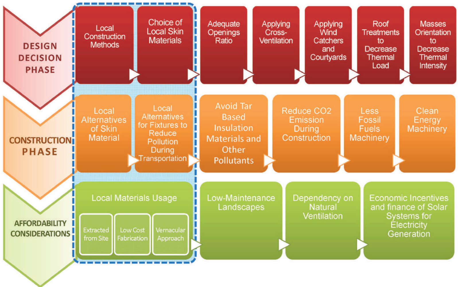
Fig. 15 | Framework for affordable sustainability in the housing sector in Egypt (credit: El-Husseiny and Kesseiba, 2019).

is not compatible with the current technological offer, and therefore not very attractive for contemporary society. In general, the data on energy consumption are alarming, since around 60% of the State's peak consumption is due to air conditioning (Attia, 2009).