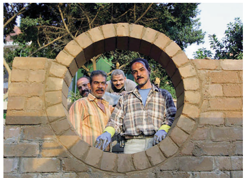
Fig. 11-14 | HBRC experiments.