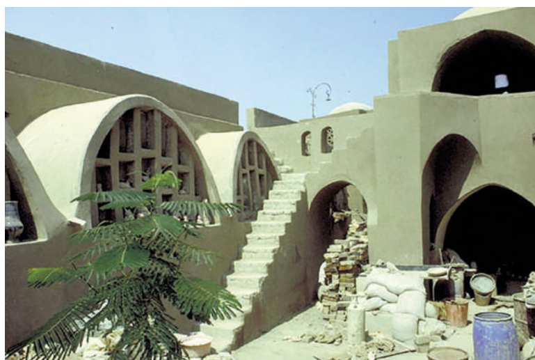
Figg. 1, 2 | Hassan Fathy Architect, New Gourna (credits: archnet.org, 2019).