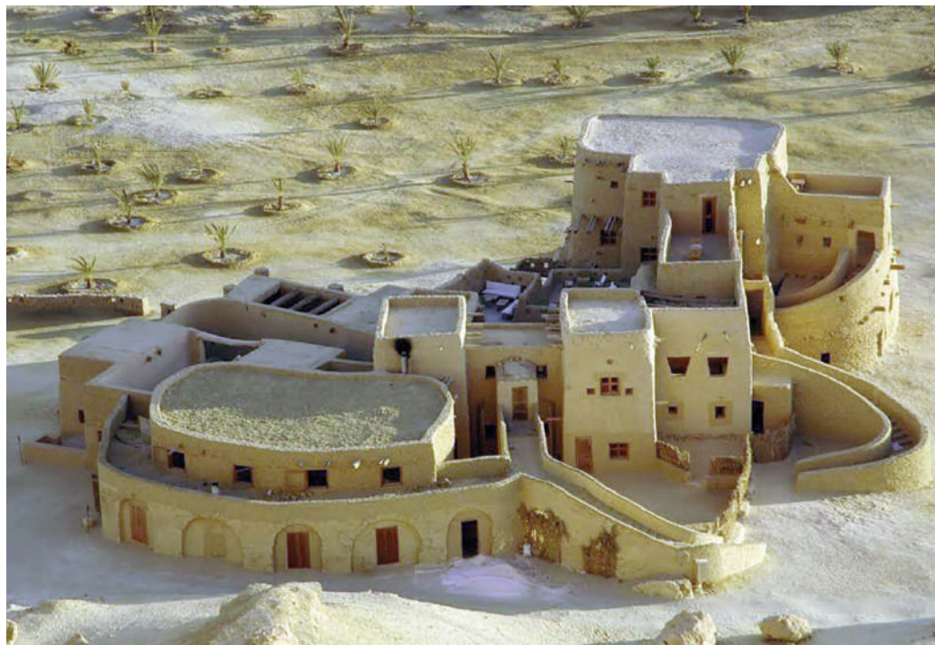
Fig. 3 | Ecolodge in Siwa.

giungimento della sostenibilità è stato definito da Campbell (1996) come il 'conflitto di proprietà'. Il paragrafo successivo ne studia i metodi sostenibili per analizzare meglio le politiche e le normative applicabili al fine di garantire una sostenibilità a prezzi accessibili.