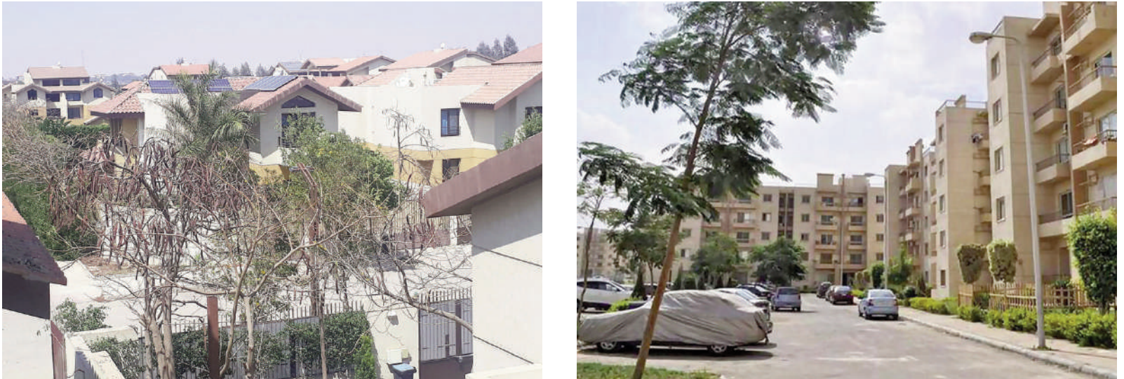
Figg. 5, 6 | Private Villas in Sheikh Zayed; Housing blocks in Sheikh Zayed (credits: El-Husseiny and Kesseiba, 2019).

zioni per la ventilazione trasversale) o all'uso di torri del vento.