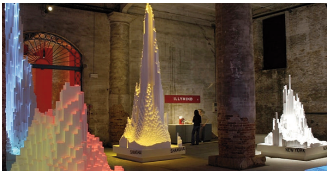
Fig. 2 | Communication keeping up with Technology.