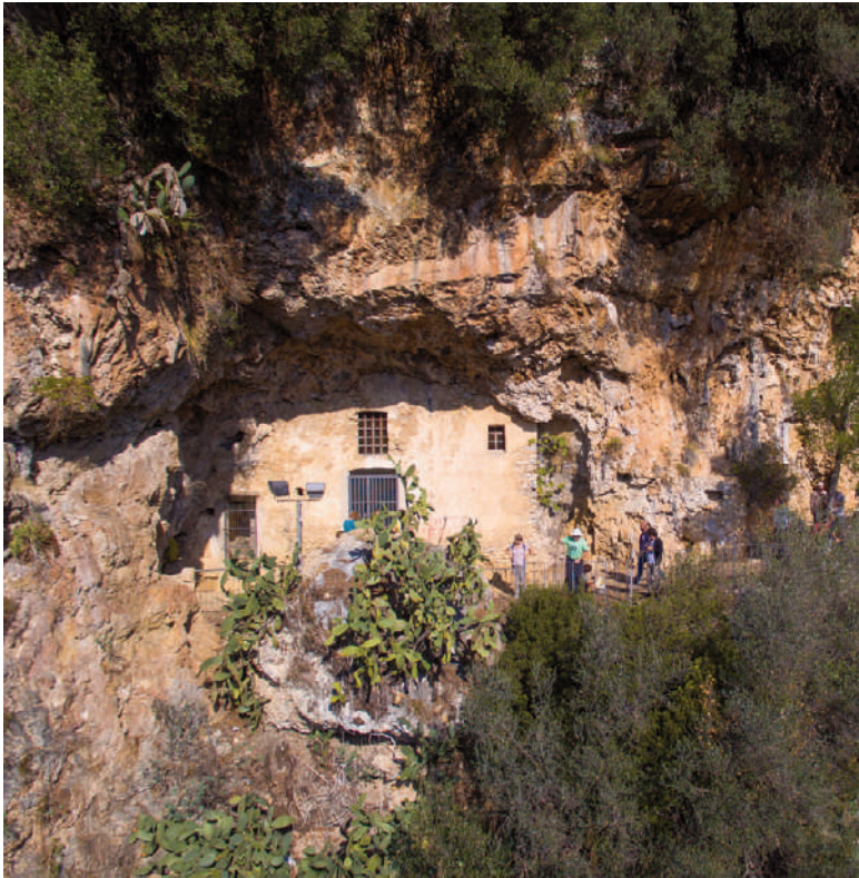
Fig. 10 | Ancient rock architecture, Camerota.