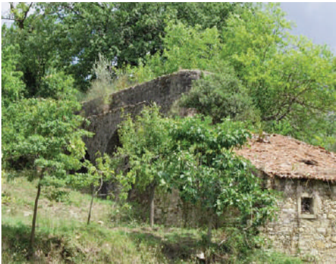
Fig. 4 | Bulifon de Silva, Campagna Felice, 1692.