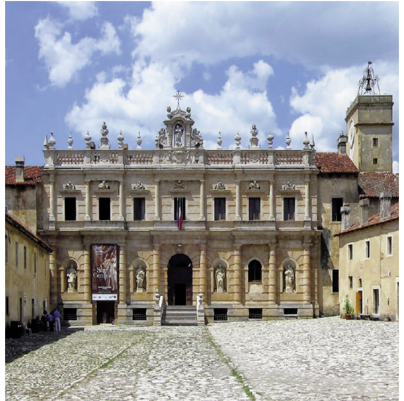
Fig. 11 | The Certosa in Padula.

ting knowledge of the Mediterranean diet» (UNESCO, 2013).