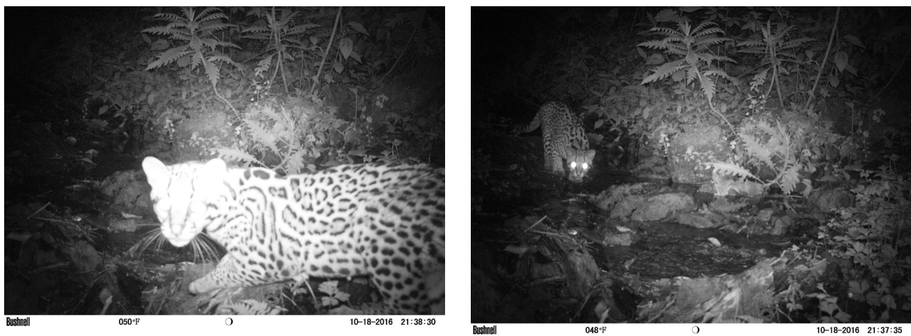
Figura 3. Primer registro para el Quindío del ocelote, Leopardus pardalis , obtenido mediante foto-trampeo en el área de conservación El Tapir, municipio de Pijao, departamento del Quindío, Colombia