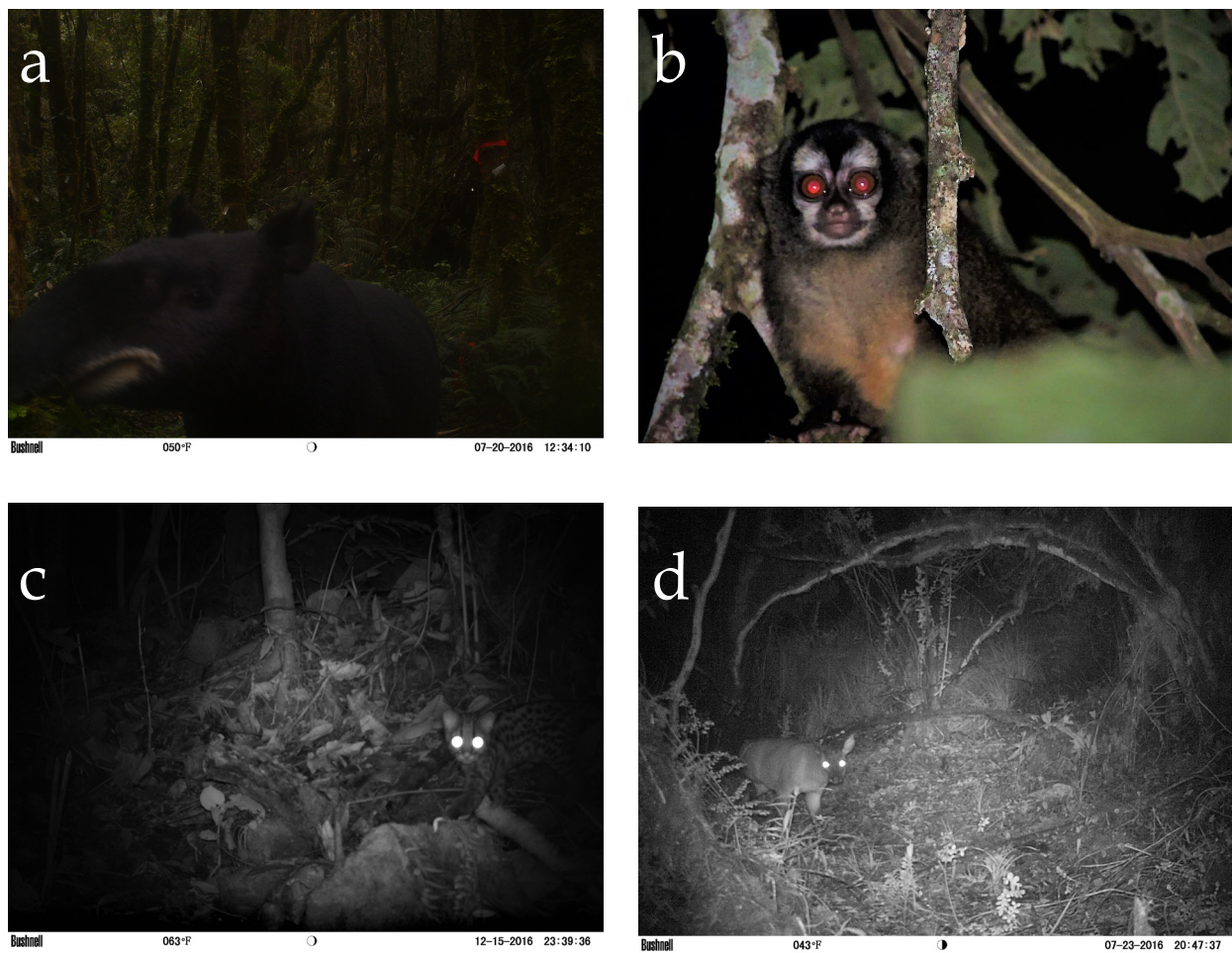
Figura 2. Especies bajo categoría de amenaza según la IUCN, registradas en 11 áreas de manejo y conservación en el departamento del Quindío, Colombia: a) Tapirus pinchaque . b) Aotus lemurinus . c) Leopardus tigrinus . d) Mazama rufina .