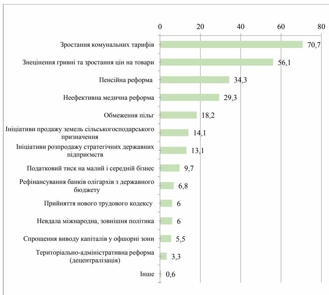
Рис. 3. Рейтинг соціально-економічних дій влади та наслідків, що турбують найбільше, %

зростання цін більше непокоїть небагатих респондентів, але таких, що не перебувають за межею абсолютної бідності (60%). Третю сходинку серед соціально-економічних дій Уряду, які викликають занепокоєння українців, займає пенсійна реформа (34,3%), яка зі зрозумілих причин більше турбує респондентів пенсійного та передпенсійного віку (відповідно, 42,3% та 42,6%), а також тих, хто перебуває за межею абсолютної бідності (44,4%). На четверту позицію вийшла проблема нібито неефективності медичної реформи (29,3%). Найбільше занепокоєння медичною реформою спостерігається в східних областях (37%) та у віковій групі 60+ (33,7%). Топ-5 проблем замикає проблема обмеження пільг, яка турбує майже кожного п'ятого опитаного (18,2%) і особливо – представників старшої вікової групи (27%) (рис. 3, табл. 3).