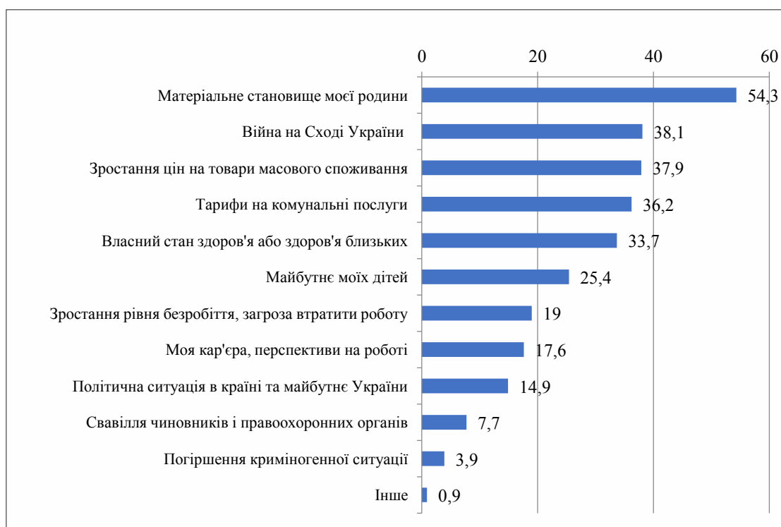
Рис. 1. Рейтинг питань, які найбільше турбують у нинішніх життєвих умовах, %

Питаннями, що сьогодні турбують українців найбільше , є матеріальне становище родини (54,3%), війна на Сході країни (38,1%), зростання цін на товари масового споживання (37,9%), тарифи на комунальні послуги (36,2%), власний стан здоров'я або стан здоров'я близьких (33,7%) (рис. 1). Порівнюючи з опитуванням у червні 2017 р., топ-5 проблем не зазнали змін, лише дещо знизилась частка тих, хто зазначив, що його турбує матеріальне становище родини (з 62,2%).