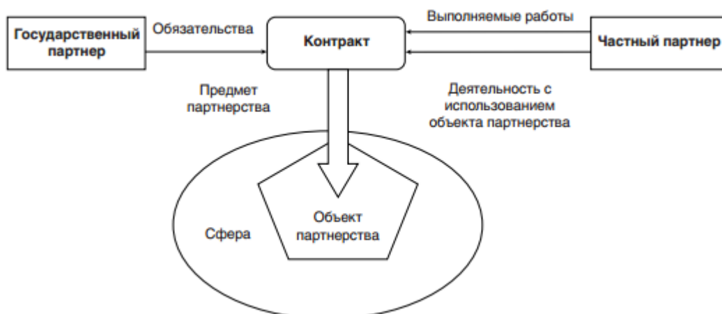
Рис. 2. Общая схема взаимодействия субъектов ГЧП

Общая схема взаимодействия довольно проста для обеих сторон (Рисунок 2).