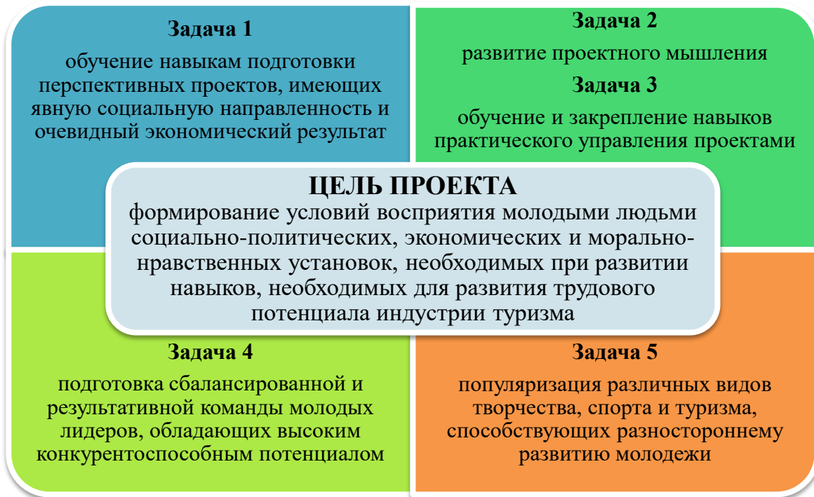
Рис. 1. Матрица целей и задач проекта молодёжный форум «Регион 93» с точки зрения влияния на трудовой потенциал будущих специалистов и управленцев

Далее, сформируем матрицу целей и задач проекта молодёжный форум «Регион 93» с точки зрения влияния на трудовой потенциал будущих специалистов и управленцев Краснодарского края (Рисунок 1).