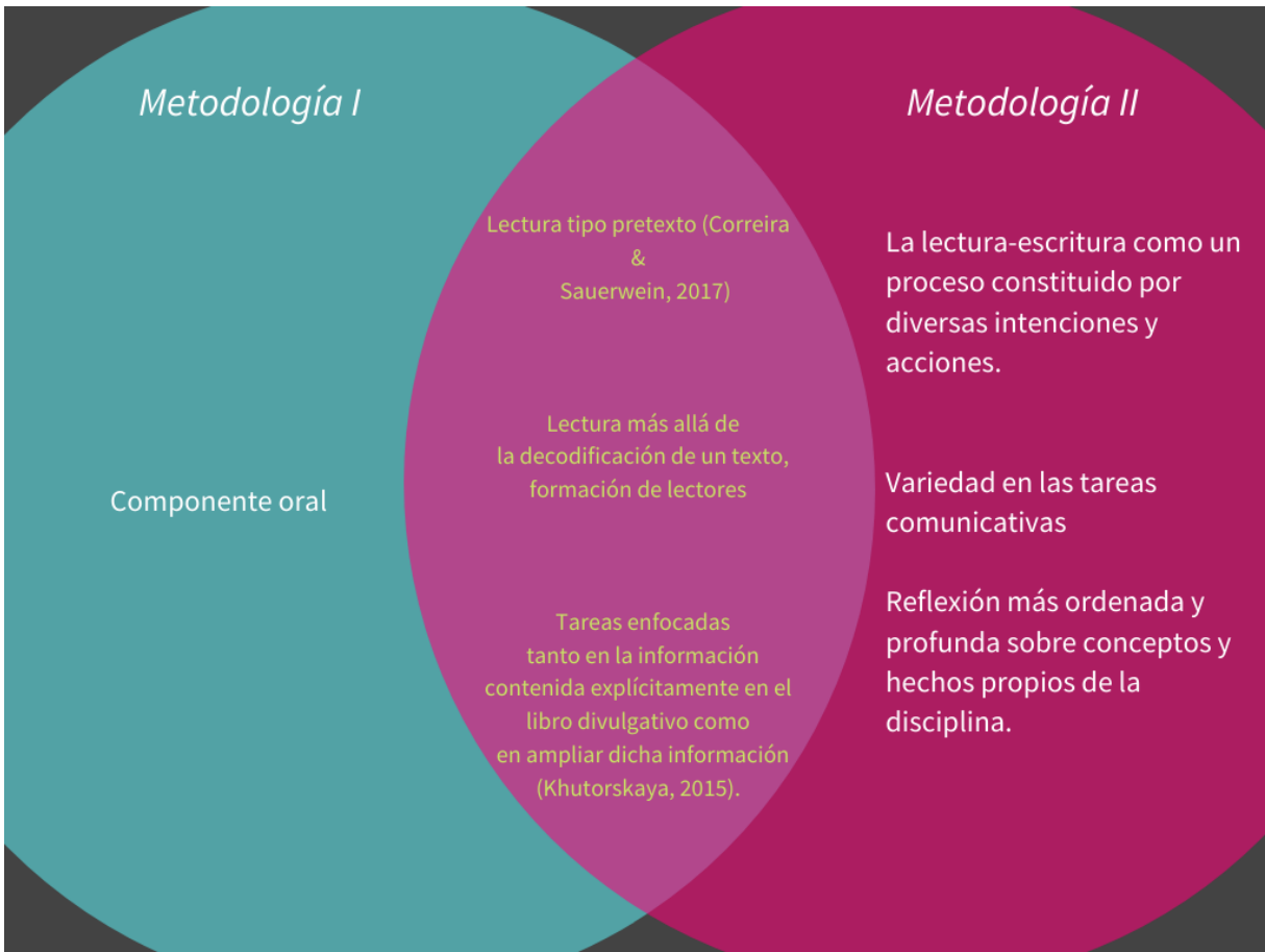
Figura 3. Diagrama de Venn que muestra las características comunes y especificidades de cada metodología.

Por otro lado, el diagrama de Venn (figura 3) resume las similitudes y diferencias de las metodologías. Entre las características comunes están la tipología de la lectura como pretexto, así catalogada cuando previamente se define una actividad a realizar a partir de lo leído. Como señalan Correira y Sauerwein (2017), determinar una finalidad de la lectura predispone la interlocución lector-texto. Asimismo, ambas metodologías conllevaron dos aproximaciones al texto: la primera, de informarse a partir de lo allí contenido y, la segunda, de ampliarlo. Cabe señalar que en la metodología II (2014-2017), las tareas intermedias fueron más enfocadas a la primera aproximación, mientras la elaboración del texto final implicó “ir más allá” de lo expuesto en el libro divulgativo (Khutorskaya, 2015). Entonces, el recurso del libro divulgativo permite explorar dos dimensiones: la disciplinar, a través del conocimiento del origen, desarrollo y aplicación de conceptos de la física; y la formación de lectores-escritores.