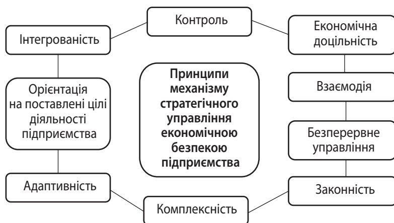
Рис. 1. Принципи механізму стратегічного управління економічною безпекою підприємства

Відповідно до природи факторів управління треба також обрати методи впливу на їх стан,