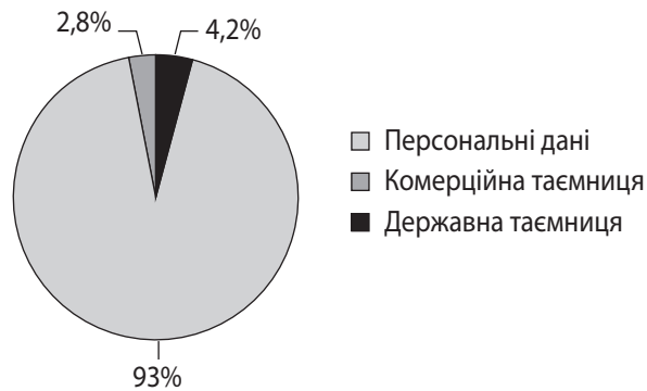
Рис. 2. Структура інформації, щодо якої була порушена конфіденційність

Відповідно до джерела [8] дослідження, які були проведені на глобальному рівні, свідчать, що із розвитком сучасних інформаційних технологій система інформаційно-комунікативного забезпечення стала ще більш вразливою. Однією із причин цього стало використання мережі Інтернет в управлінських цілях та в повсякден-