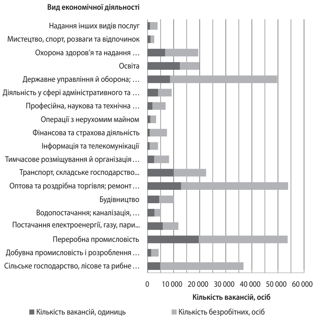
Рис. 3. Кількість вакансій і чисельність безробітних станом на 1 листопада 2019 р. за видами економічної діяльності