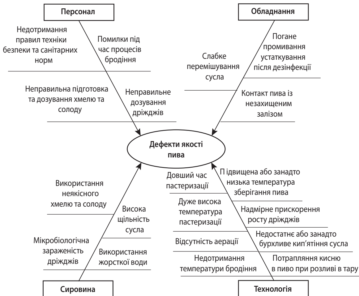
Рис. 2. Причини виникнення дефектів якості пива ПрАТ «Пиво-безалкогольний комбінат «Радомишль»