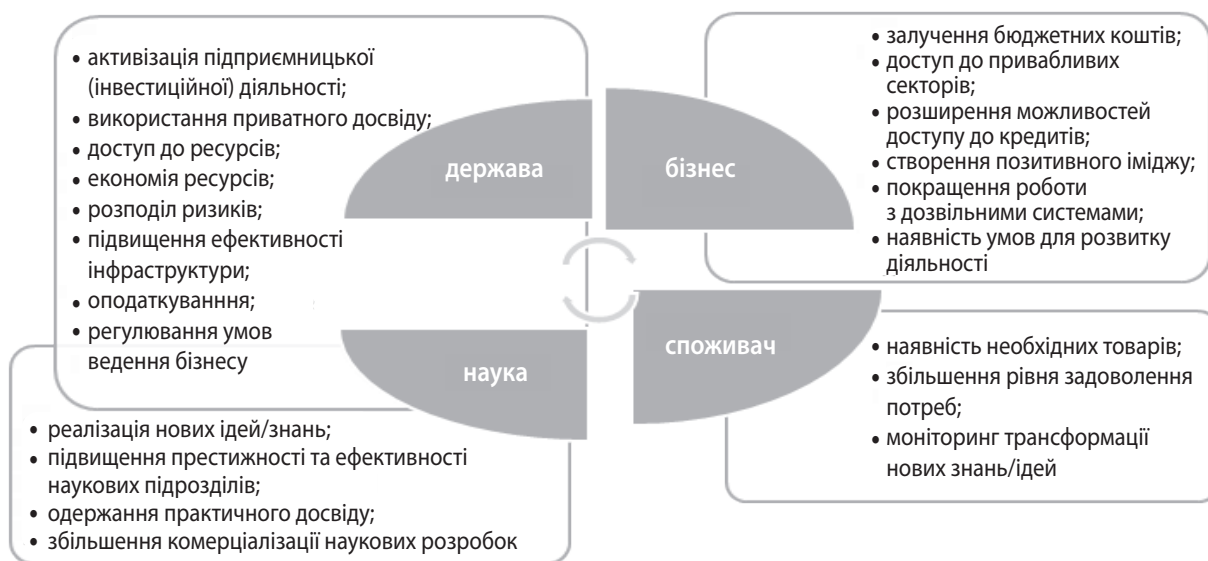
Рис. 2. Матриця інтересів налагодження взаємодії у інноваційних процесах

Корисність взаємодії учасників необхідно вимірювати в кількісних одиницях (ютилях), тому вона відображає загальний рівень задо-