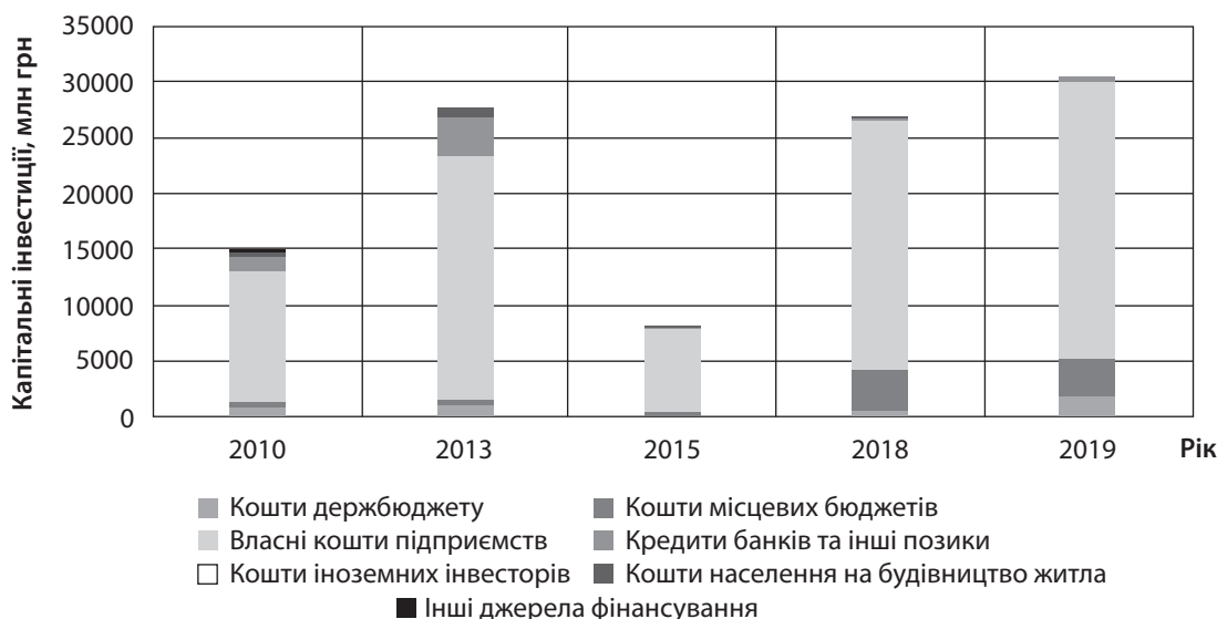
Рис. 1. Обсяги капітальних інвестицій у Донецькій області за джерелами фінансування*, млн грн

Примітка: * – за 2015–2019 рр. дані наведено без урахування частини тимчасово окупованої території в Донецькій області.