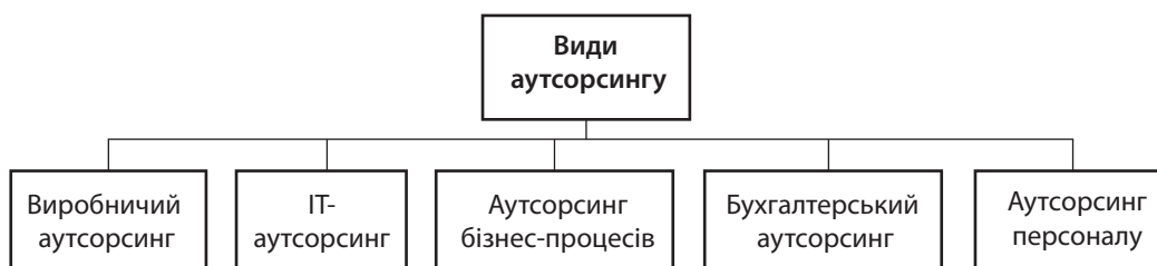
Рис. 2. Класифікація видів аутсорсингу