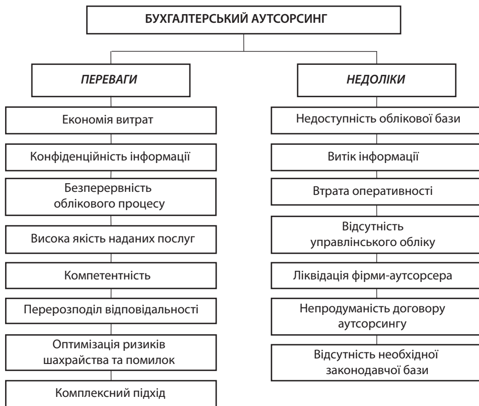
Рис. 3. Переваги та недоліки ведення бухгалтерського обліку аутсорсинговою компанією