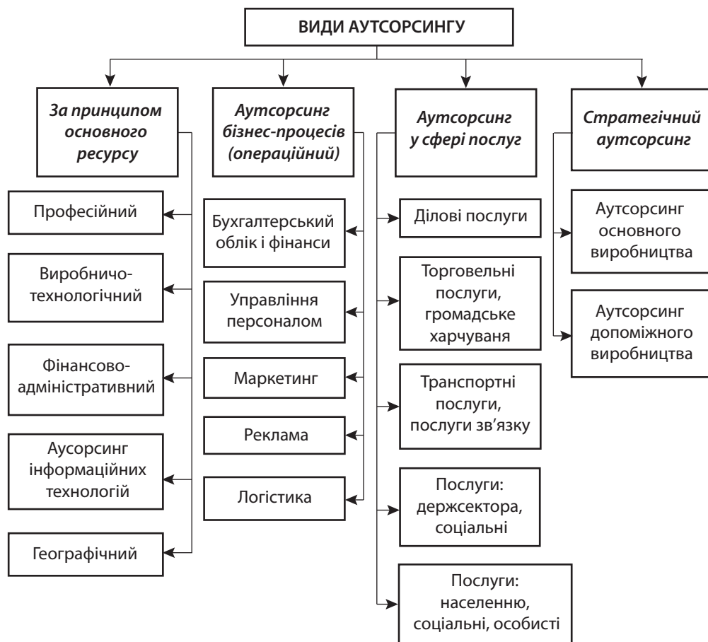
Рис. 2. Класифікація аутсорсингу в системі управління підприємством