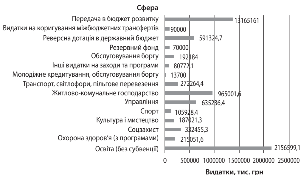
Рис. 2. Структура видатків загального фонду бюджету Львова на 2020 р., тис грн [13]

успішного втілення реформ необхідно постійно здійснювати контроль і проводити внутрішній аудит.