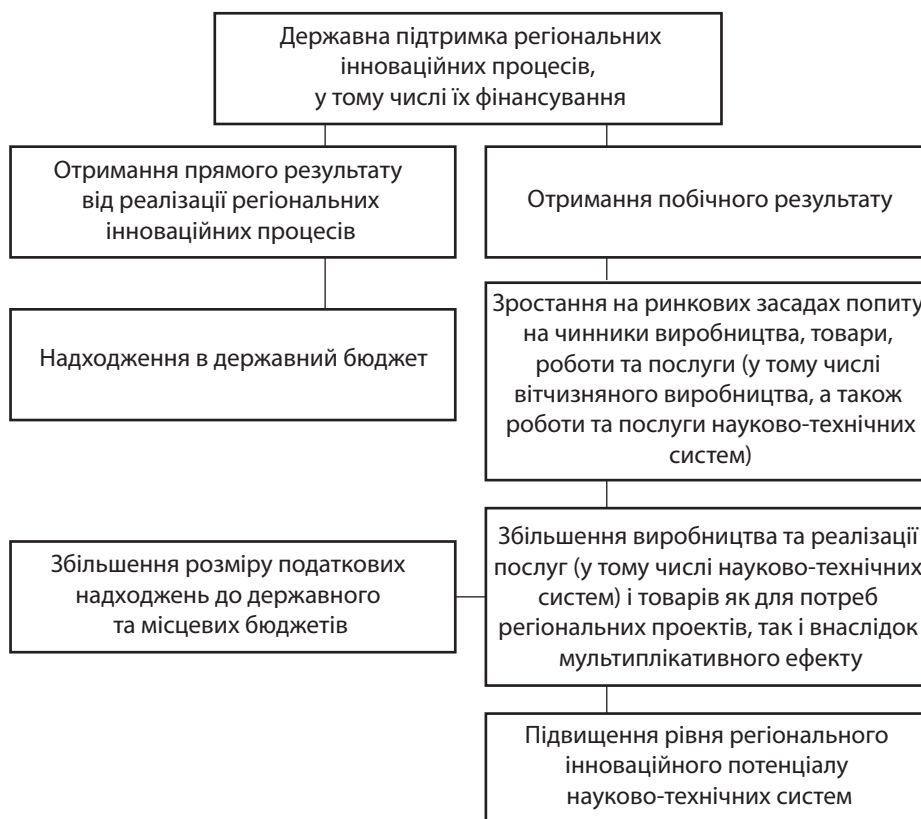
Рис. 1. Причинно-наслідковий зв'язок державної підтримки регіональних інноваційних процесів

Причинно-наслідковий зв'язок державної підтримки регіональних інноваційних процесів наведено на рис. 1 .