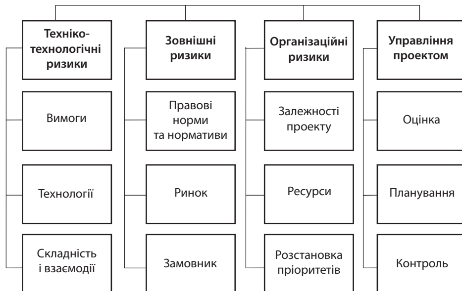
Рис. 2. Ієрархічна структура ризиків для ІТ-компаній

Для ефективного управління проектними ризиками в ІТ-компаніях доречним буде побудова ієрархічної структури ризиків (рис. 2).