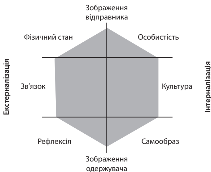
Рис. 1. Призма ідентичності бренда

Керівництво компанії підкреслює значимість бренда як конкурентної переваги, але, перш за все, важливість бізнес-моделі, на якій він заснований. Іс-