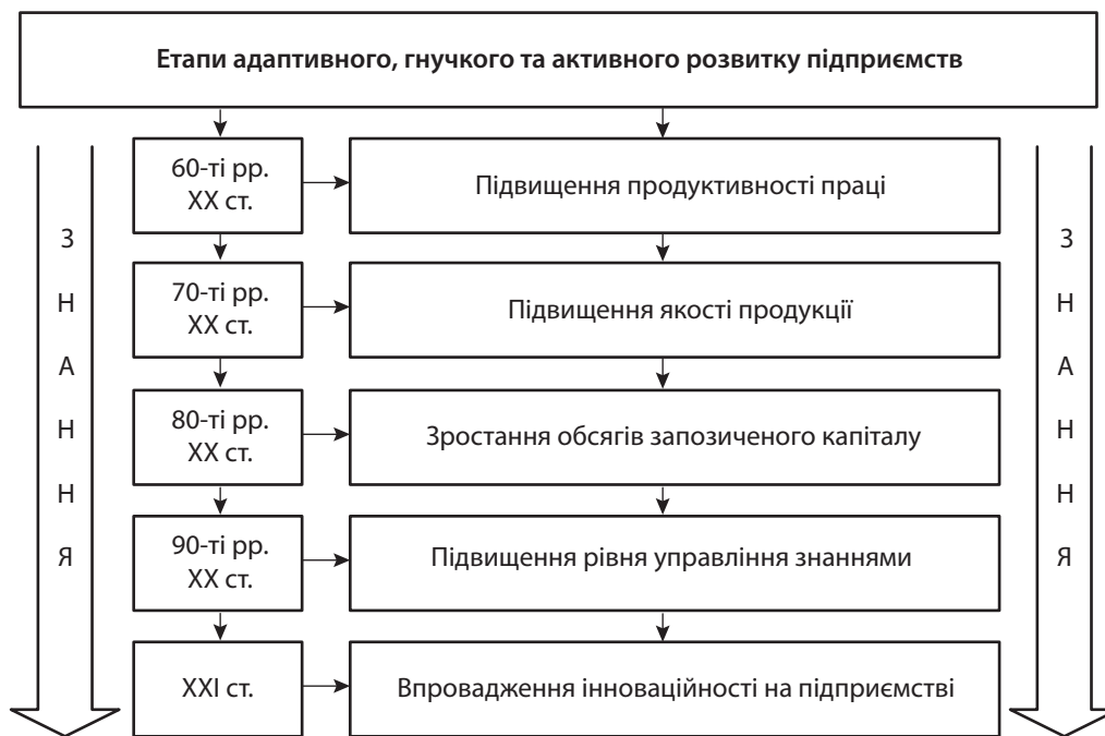
Рис. 1. Етапи адаптивного, гнучкого та активного розвитку підприємств

Головними проблемами сталого розвитку інноваційності вітчизняних підприємств є: зменшення рівня наукоємності виробництва; низький рівень розробки та впровадження інноваційності, відсутність дієвих державних програм з розвитку інноваційності; низький рівень використання механізму партнерства в реалізації інноваційних проєктів; низький рівень соціальних гарантій для науковців та висококваліфікованих фахівців; низький рівень взаємодії між бізнесом і закладами вищої освіти тощо.