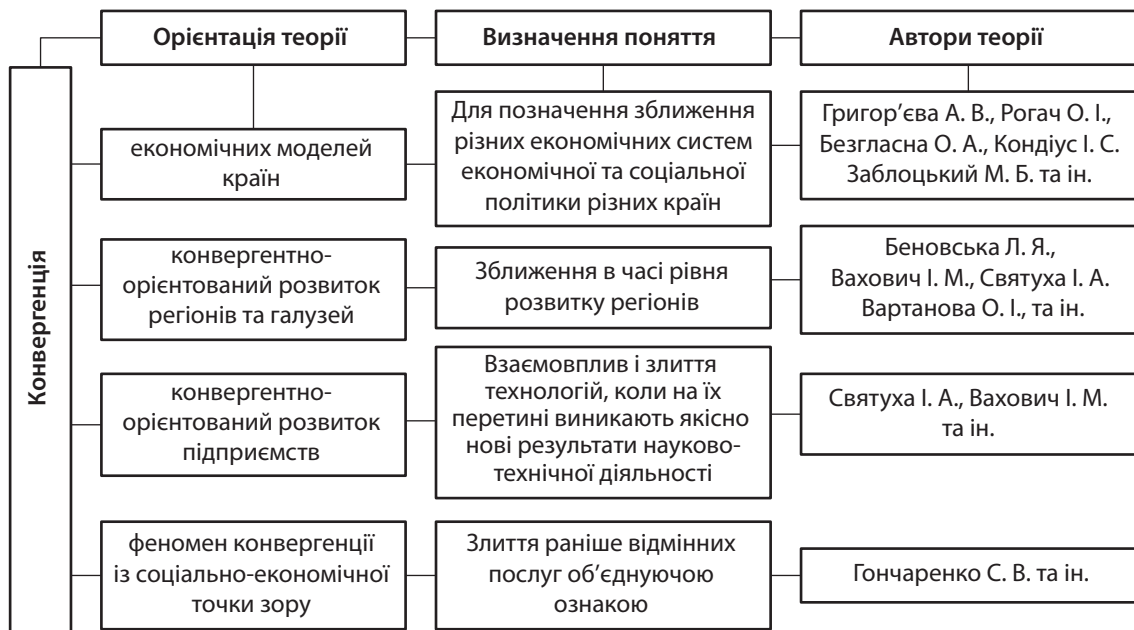
Рис. 1. Сучасний зміст процесу конвергенції