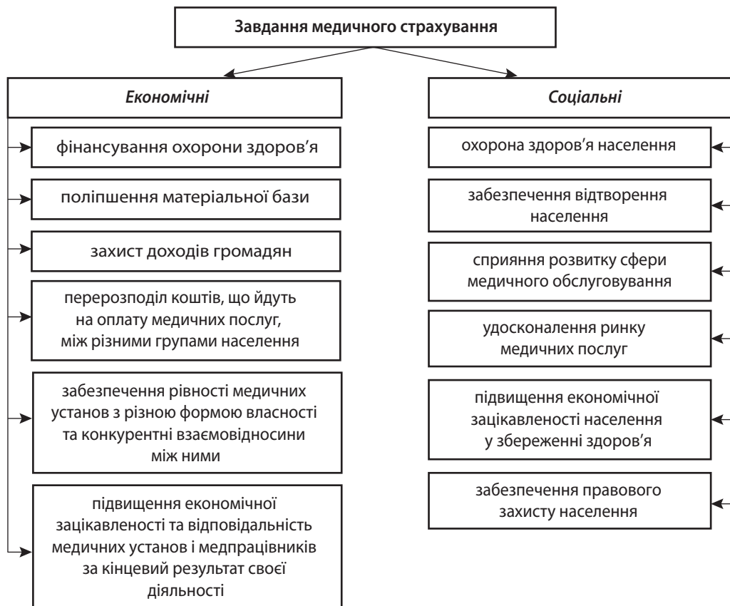
Рис. 1. Соціальні та економічні завдання медичного страхування [4]

Страхова медицина регулює багато аспектів щодо джерел фінансування (рис. 2), перехід на нові форми організації та управління в системі охорони здоров'я, оплати праці (згідно зі стандартами надання медичної допомоги та оцінкою якості проведеного лікувально-діагностичного процесу) за обсяг виконаної роботи, зміни пріоритетів у наданні медичної допомоги (зі стаціонарної допомоги на амбулаторно-поліклінічну), високу якість медичних послуг та їх відповідність соціальним гарантіям страхового поліса, вільного вибору пацієнтом лікаря та лікувально-профілактичного закладу, боротьби за пацієнта та багато чого іншого [3].