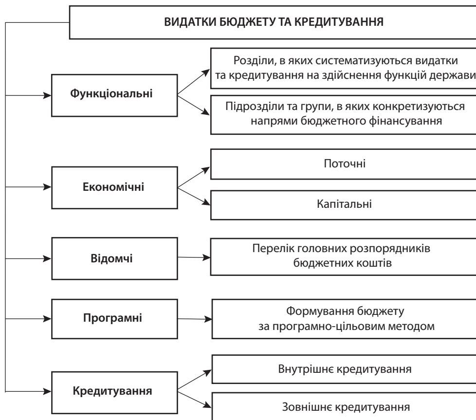
Рис. 2. Бюджетна класифікація видатків бюджету та кредитування