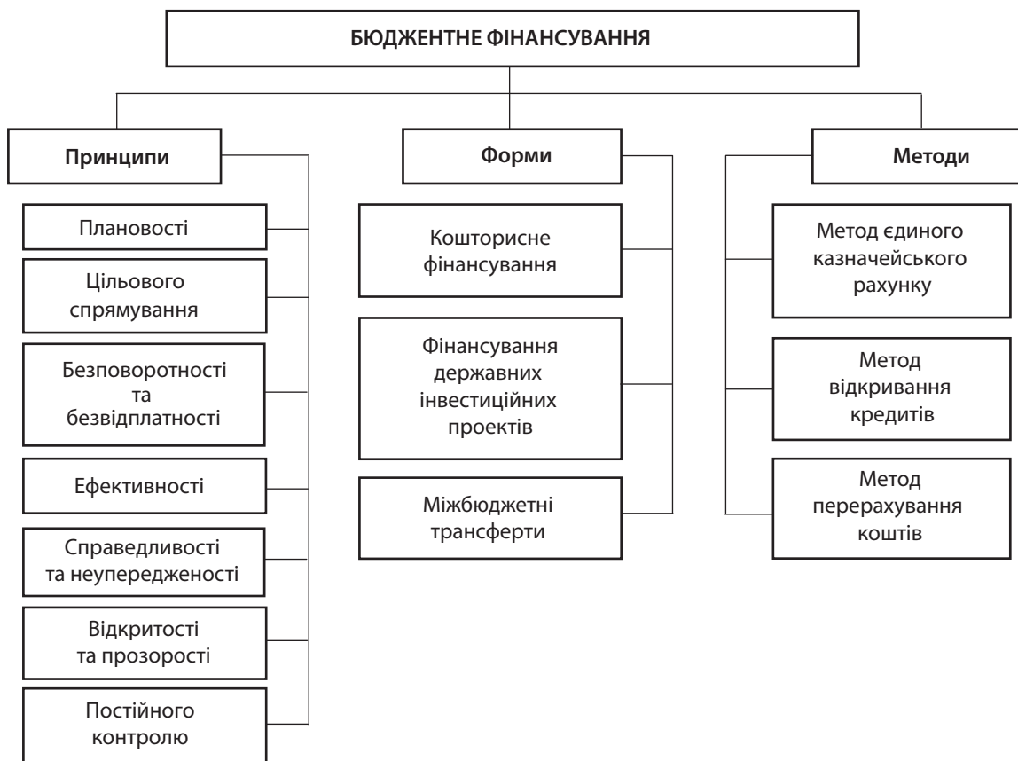
Рис. 1. Структура системи бюджетного фінансування