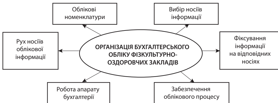
Рис. 2. Основні напрямки організації бухгалтерського обліку фізкультурно-оздоровчих закладів

Найважливіші напрямки організації бухгалтерського обліку господарської діяльності фізкультурно-оздоровчих установ наведено на рис. 2 .