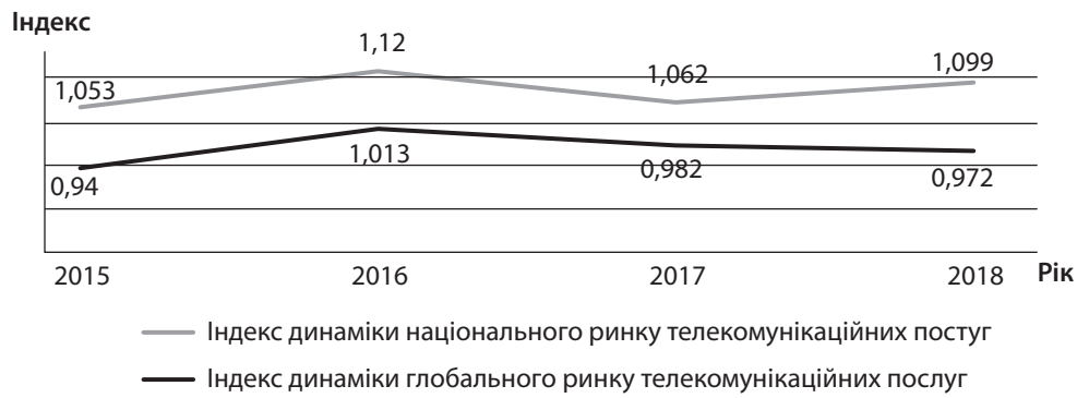
Рис. 1. Індекс динаміки ринків телекомунікаційних послуг у світі та в Україні за період 2015–2018 рр.