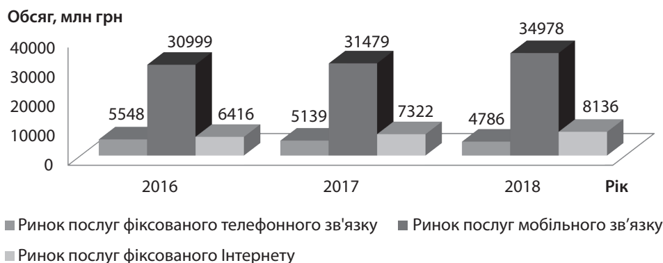
Рис. 2. Обсяг ринку телекомунікаційних послуг України за період 2016–2018 рр. у розрізі секторів, млн грн без ПДВ