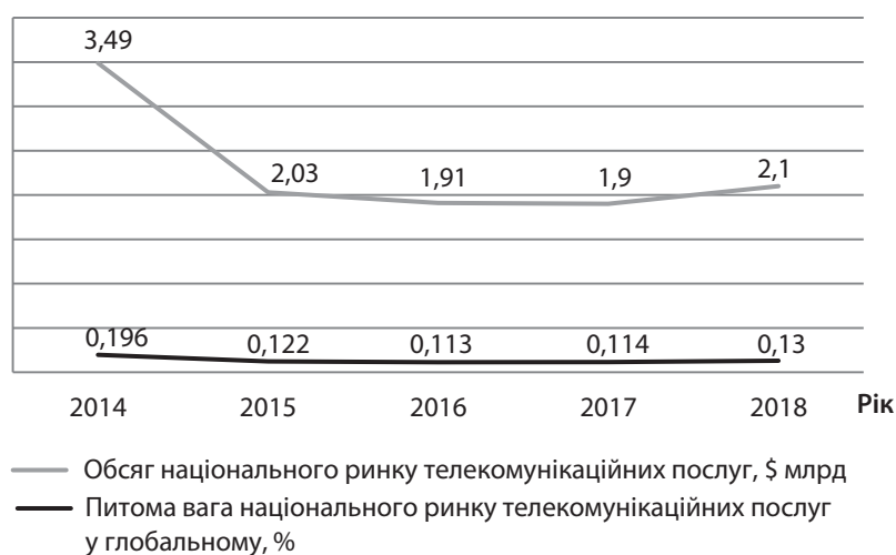
Рис. 3. Внесок ринку телекомунікаційних послуг України у глобальний за 2014–2018 рр.