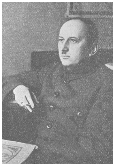
Рис. 2. А.А. Свечин (1923 год)

Офицеры подготовили свои расчеты в начале февраля 1915 года для обеспечения операции как в период перевозки войск по Черному морю, так и по окончании перевозки для обеспечения коммуникационной линии высадившейся армии. На флот Черного моря (имеется в виду военный и гражданский – Авт.), помимо организации самой транспортной флотилии и подготовки пунктов посадки и высадки, возлагаются нижеследующие задачи: