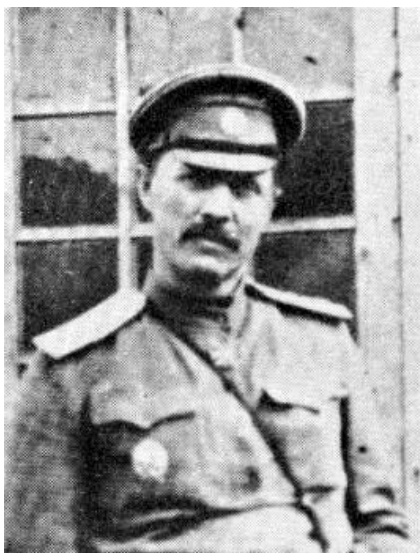
Рис. 1. Е.Е. Вышинский (период Первой мировой войны)