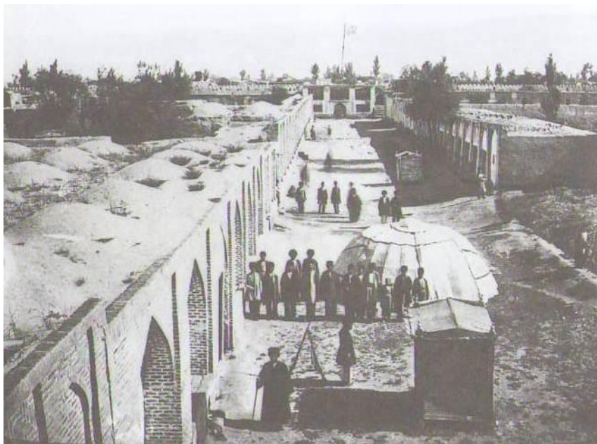
Рис. 1. Вид на город Ардебиль

5 августа в Ардебиле состоялось открытие нового энджумена. Проведением выборов руководили пришлые фидаи, разославшие свои избирательные списки лишь той части населения, на которую они могли положиться. Для большей уверенности в успехе подача голосов производилась открыто под наблюдением тех же фидаев. Благодаря всем этим мерам, из 40-тысячного населения города в голосовании участвовали 2,5 тыс. человек и наибольшее число голосов получил Мир Махмуд, организатор похода из Астары в Ардебиль (ЦГИАГ. Ф. 15. Оп. 1. Д. 170. Л. 157).