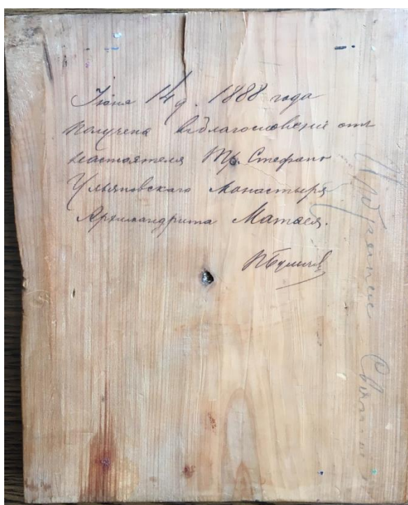
Рис. 2. Икона «Святые покровители Троицкого Стефано-Ульяновского монастыря». Обрат.

Известно, что русские монастыри, в частности в северных районах (например, Спасо-Преображенский Соловецкий), изготавливали для подарков и продажи богомольцам благословенные образки с изображением основателей обители и связанных с ее историей чудотворцев. Если большинство приходящих в монастырь окрестных жителей получали в благословение полиграфические бумажные образки, то тщательно выполненные в традиционной иконописной технике по золоту на дереве со сложным орнаментальным обрамлением миниатюрные паломнические иконы, скорее всего, создавались как дары особо значимым богомольцам. Подтверждением тому служит выполненная на обороте иконы чернильной ручкой надпись: «Июня 14 д. 1888 года получена в благословение от настоятеля Тр.-Стефано-Ульяновского монастыря архимандрита Матфея». Поблекшая подпись не вполне прочитывается, возможно – «П. Бульчев» (Рис. 2). Из текста можно сделать вывод, что икона выполнена по заказу настоятеля обители архимандрита Матфея.