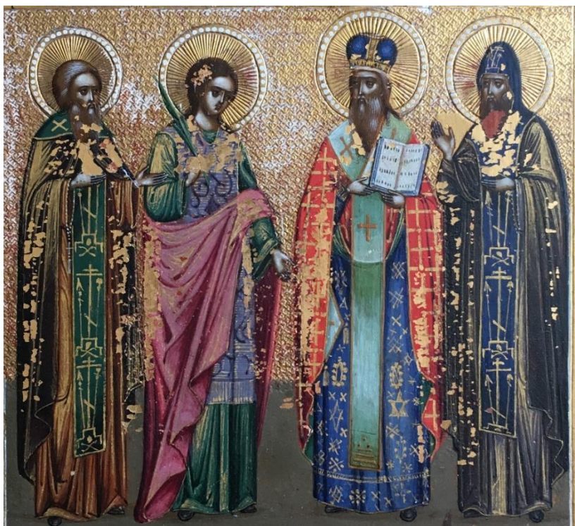
Рис. 4. Икона «Святые покровители Троицкого Стефано-Ульяновского монастыря». Средник. Фрагмент.

Включение этих святых в композицию образа главной церкви обители демонстрирует связь Троице-Стефано-Ульяновского и Соловецкого монастырей. Именно из Соловецкого монастыря, совершив литургию в храме Зосимы и Савватия, отправились в 1866 году в непростую многодневную дорогу пятеро иноков для возобновления в Ульяново монашеской жизни (Арсеньев, 1994: 42).