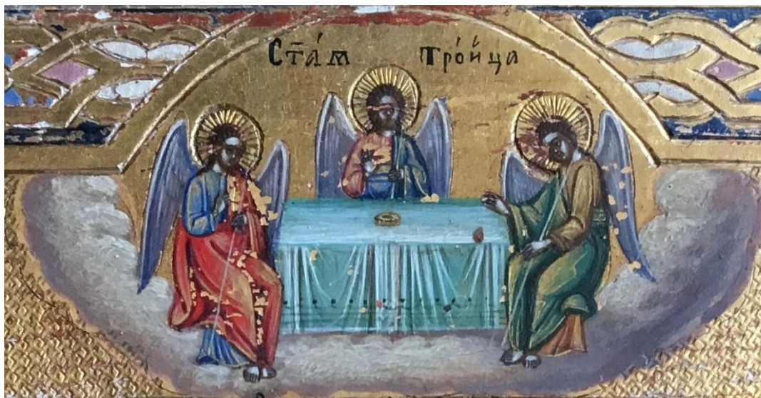
Рис. 3. Икона «Святые покровители Троицкого Стефано-Ульяновского монастыря». Святая Троица. Фрагмент средника.

Образы святых в среднике иконы представлены предстоящими изображенной в верхнем сегменте «неба» Святой Троице в традиционном иконографическом типе, производном от «Гостеприимства Авраама» («Троица Ветхозаветная») (Рис. 3). Согласно агионограммам, трое святых – прославленные в северных русских землях Стефан Пермский, в чье имя поименован монастырь, и преподобные Савватий и Зосима Соловецкие. Икона, таким образом, представляет святых покровителей Ульяновского Троицко-Стефановского монастыря в молитве Святой Троице.