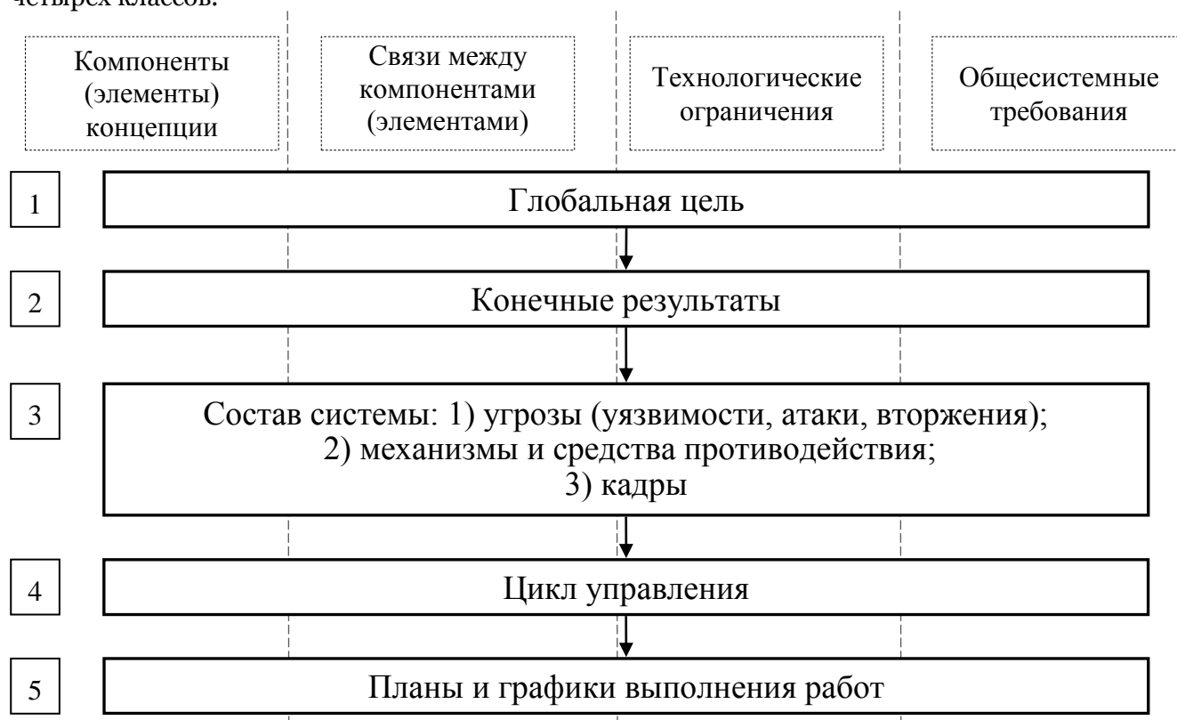
Рис. 1. Общее описание процедуры построения дерева задач при системно-концептуальном подходе

Общая структура предлагаемой процедуры совершенствования системы ОИБ приведена на Рисунке 1 . В рамках предлагаемого подхода весь процесс реализации процедуры построения дерева задач по совершенствованию (проектированию) системы ОИБ на основе СКП проводится параллельно применительно к каждому из выделенных четырех классов.