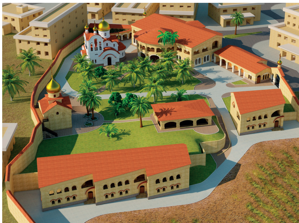
Рисунок 3. Проект развития иерихонского участка, 2008 г.

В 2008 г. Уральской горно-металлургической компанией под руководством А.А. Козицына был разработан и предложен один из проектов застройки и развития Иерихонского подворья (рисунок 3), который включал в себя увеличение площадей главного паломнического дома за счет расширения второго этажа, строительство дополнительного паломнического дома, возведение храма, установку купола на часовню, возведение вспомогательных строений, обновление ограды участка, развитие его инфраструктуры.