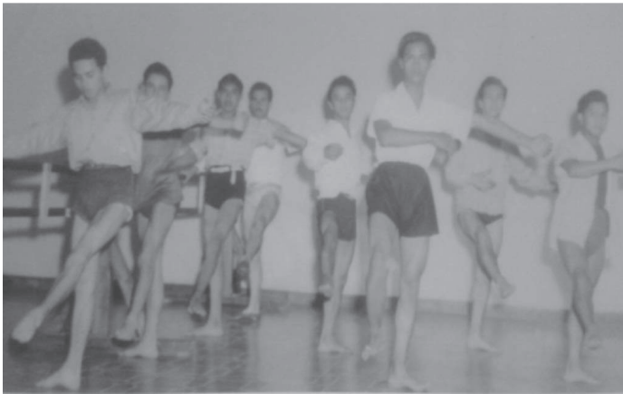
Fotografía 6. Clase de Danza en el Instituto Belén, enero de 1948.