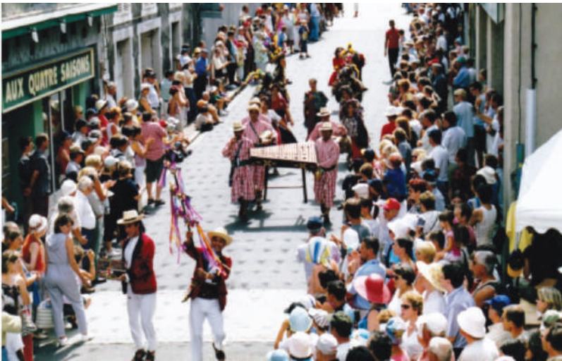
Fotografía 30. Gira a España, 1999.