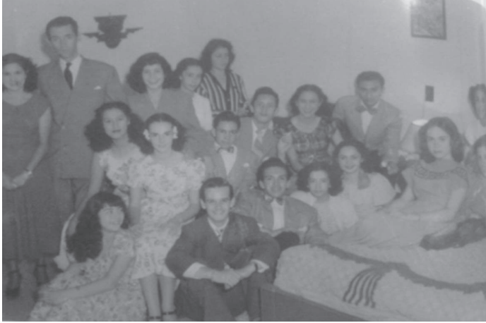
Fotografía 5. Fundadores del Ballet Guatemala. Antigua Guatemala, 1948.