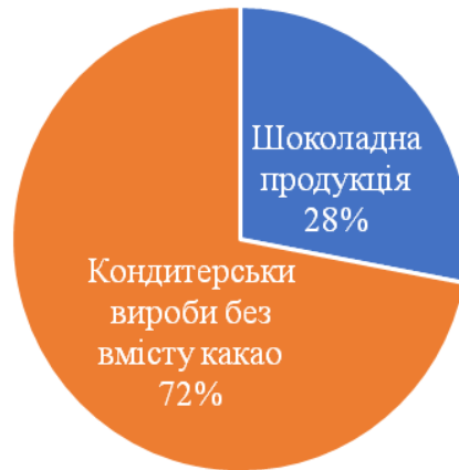
Рис. 5. Частка шоколадних виробів на кондитерському ринку України у 2018 р., % (складено автором на основі даних [7])

2017 рік став початком відновлення виробничих показників шоколадної галузі України. Її подальший розвиток буде залежати від динаміки збільшення доходів населення нашої країни та успішності подальшої реалізації експортного потенціалу на міжнародному ринку. Перспективним для цього є азіатський напрямок, де зосереджена велика кількість потенційних споживачів українського шоколаду, люблячих якісні солодощі в яскравій упаковці [11].