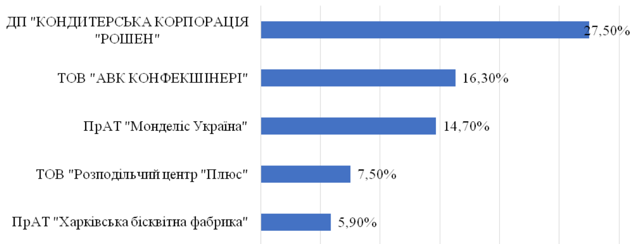
Рис. 3. Головні експортери шоколадних виробів у 2018 році [12]

У 2017 році загальний обсяг експорту шоколадних виробів становив 60,898 тис. т із загальною вартістю 150,113 млн. дол.