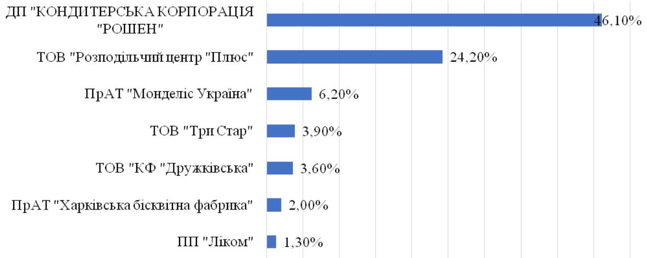
Рис. 2. Головні експортери кондитерських виробів у 2018 році [12]

Тому поставки цього товару до Європи дуже перспективні. У 2018 році до ЄС експортували понад 10 000 тонн.