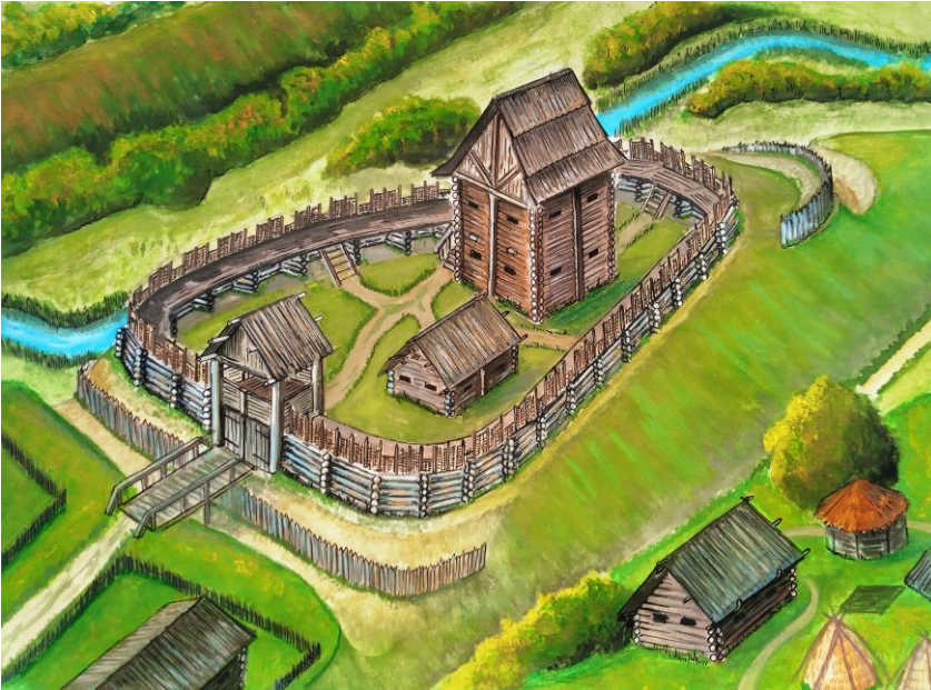
Рис. 3. Реконструкция замка Сновск состоянием на начало XV в. Вид с севера. Рисунок автора

Письменные источники подтверждают существование Сновска в это время, как укрепленного пункта. В «Списке русских городов дальних и ближних», датируемого между 1371 и 1385 гг., Сновск упоминается как «Сновескъ». Вероятно именно эти укрепления и относятся к «Сновеску». Несколько позднее Сновск упоминается в «Списке городов Свидригайла» 1432 г., однако, как свидетельствует археология, в это время он уже находился снова на старом месте, то есть на древнерусском городище.