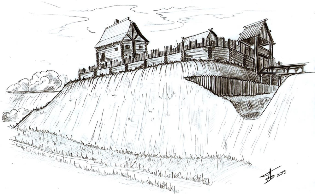
Рис. 2. План городища в м. Седнев (остатки замка Сновск). Топоъемка автора, 2014

(Рисунок 2). Размер укрепленной площадки составлял всего 32x22 м. Вал находился только с западной напольной стороны, по периметру площадки городища, земляные укрепления отсутствуют, что может указывать на то, что здесь находились лишь деревянные стены. С противоположной восточной стороны, где стрелка мыса довольно пологая, так же был выкопан ров и насыпан небольшой вал. По археологическим данным, сооружение укреплений датируется второй половиной XIV в., что соответствует времени присоединения Черниговщины к Великому княжеству Литовскому.