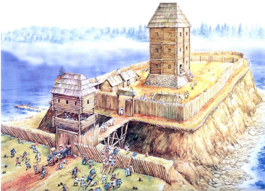
Рис. 5. Реконструкция замка Мариенвердера Тевтонского ордена, 1234 г. (По изданию: Turnbull S. Crusader castles of the Teutonic knights (1), P. 18)

Само по себе городище небольшое, всего 30x20 м, вытянутое с востока на запад (Рисунок 4). С востока и юга городище было укреплено валом. Сегодня его ширина составляет 10 м, а высота до 1 м. Ров опоясывает укрепления с трех сторон, а с северной стороны упирается в старое русло Днепра. Само по себе укрепление находится на острове размером 300x400 м. Замок расположен в северной части этого острова, а на юг от него находилось поселение-посад. Вероятно, что роль укреплений играли водные преграды, что окружали остров с четырех сторон. Навоз, как городской центр не прекращал существование и в последующие времена (Коваленко, 2011: 128-130). Так, Навоз (Навозы) упоминаются в документах под 1488, 1527 гг. (Горбещь, 2014: 94; Русина, 1998: 208; Кондратьев, 2011: 32-33). Однако, уже со середины XVI в. Навоз становится селом, утративши городской статус, а в XVIII в. на старом «замчище» был сооружен укрепленный двор Киево-Печерской Лавры. Именно эти перестройки и уничтожили остатки застройки XIV в. (Бондар, 2017: 14-15).