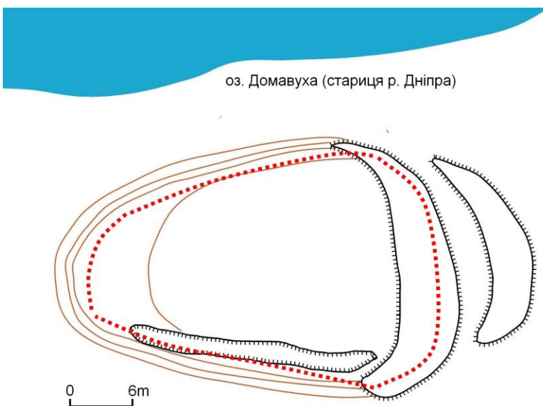
Рис. 4. Реконструкция замка Сновск состоянием на начало XV в. Рисунок автора

В том же «Списке русских городов дальних и ближних» упоминается еще один населенный пункт – Навоз. Сегодня это село Днепровское (Тихомиров, 1979: 95). Этот населенный пункт отождествляется учеными с городищем Домавуха, в южной оконечности Днепровского (Коваленко, 1991: 75-76). Возникновения городища, традиционно относится к XII в., однако никаких оснований для этого нет. Археологические раскопки проводились только на незначительной площади и показали наличие материалов с XI до XVIII ст.