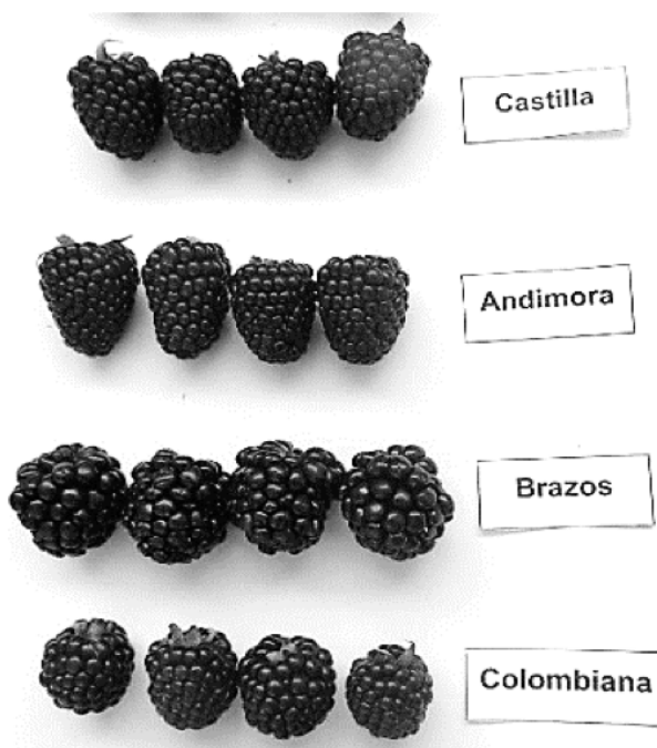
Figura 1. Cultivares de mora utilizados en el ensayo

Para la definición de los descriptores se emplearon los recomendados por la Unión Internacional para la Protección de las Obtenciones Vegetales (UPOV), adaptado a las condiciones nacionales Ecuador (INIAP, 2017), los descriptores morfológicos fueron: hábito de crecimiento, longitud, diámetro, sección transversal y pigmentación antocianica de tallo; espinas y tamaño