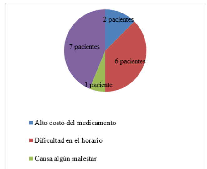
Figura 3 – Gráfico de frecuencia de dificultad con el tratamiento

De los 37 pacientes participantes, solamente 15 (40,5%) de ellos afirmaron encontrar dificultad en el tratamiento, siendo ellas el alto costo de la medicación, la dificultad en el manejo del horario, por algún malestar que les cause y otras, cómo demostrada en la Figura 3.