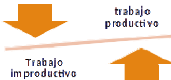
Figura 3. El trabajo productivo en la sociedad y la economía actuales aplica visión, saber y conceptos, es trabajo que se basa en la mente y no en la mano.

En “Sociedad del conocimiento” (DRUCKER 1959; 1969), Drucker introduce el concepto de “Revolución Educativa” como factor clave del desarrollo. “Ha sobrevenido un cambio súbito y radical en el significado y los efectos del saber para la sociedad. Porque ahora podemos organizar a individuos de alta pericia y sabiduría para el trabajo colectivo mediante el ejercicio del juicio responsable, el individuo altamente educado se ha convertido en el recurso central de la sociedad de hoy” (DRUCKER 1959): “El trabajo productivo en la sociedad y la economía actuales aplica visión, saber y conceptos, es trabajo que se basa en la mente y no en la mano”. Debido a esto “no habrá superoferta permanente de gente instruida” (Figura 3).