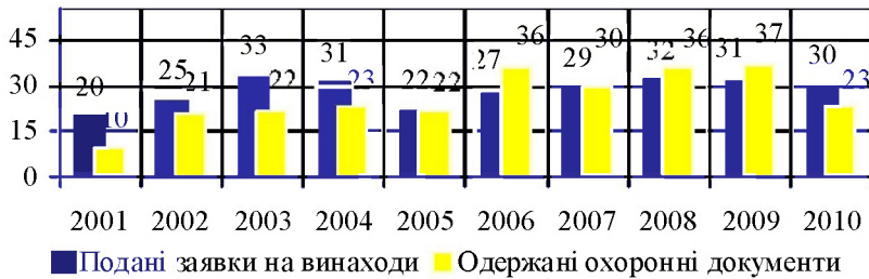
Рис. 3. Динаміка показників винахідницької діяльності ДНУ ім. О. Гончара [11]

ним питання щодо того, якою має бути структура некомерційних форм трансферу технологій з позиції визначення їх ефективності та впливу на інноваційний розвиток саме нашої економіки. Адже загальновідомим є те, що багато наукових розробок та пропозицій так і залишаються невикористаними в Україні. Ми вважаємо, що ця проблема є не лише проблемою інноваційного менеджменту університету.